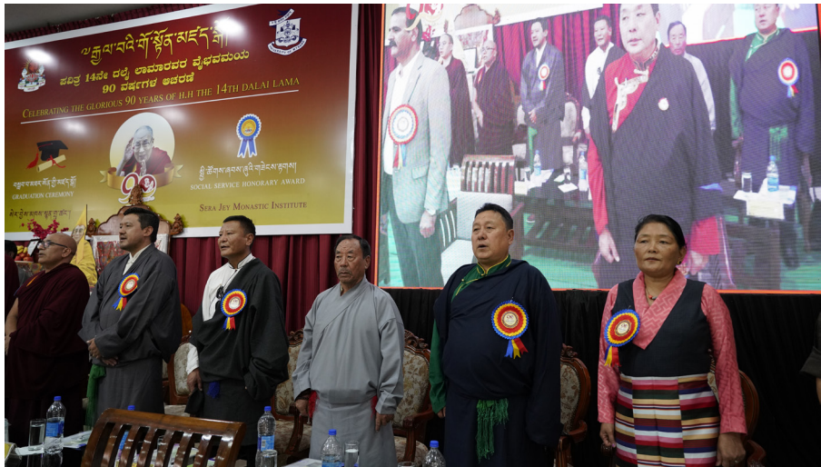
ཕྱི་ལོ་ ༢༠༡༥ ལྷ་ ༡༠ ཚེས་ ༡༨ ཉིན་སེར་གྲེས་མཁམ་སྐྱེན་གྲུ་ཚང་ནས་ཡ་སྐལ་གོ་སྤོན་དང་འབྲེལ་བཞེས་བཞེད་ལོ་སྐྱེད་བཞེད་སྤྱི་ཚོགས་ གྲེས་བཀའ་ལེན་ཚོས་སྤྱི་ཚོགས་ཡོན་ཏན་ལྡན་པའི་ཕྱི་ལོ་སེར་གྲེས་ཚང་སྤྱི་ཚོགས་ཀྱི་ཕྱོགས་ལག་རབ་འབྲེལ་སྤྱི་ཚོགས་དང་པོའི་བསྐྱེད་པ་མཐར་ མོན་གྱི་མཚན་རྒྱུ་སྤྱི་ཚོགས་ཤིང་མེ་མང་ཕྱོགས་བཞེས་པའི་འདུགས་སྤྱི་འབྲེལ་རྒྱལ་ཤོག་པ།

ཡུང་རིན་པོ་ཆེ་ཆགས་ཀྱི་ཡོད་རེད། ས་སྐྱ་ ལེགས་བཤམ་ནང་། ཡོན་ཏན་ལྡན་པ་སྐྱེ་བོ་ ཀུན། །མ་བསྐྱུས་པར་ཡང་རང་ཉིད་འདྲ། །རི་ཞིམ་མེ་འོག་རྒྱང་རིང་ཡང་། །བྱང་བ་ སྤྱིན་ཀྱི་ཚོགས་བཞེན་འཁོར། །ཡོན་ཏན་ ལྡན་པ་ཡིན་ན་སྐྱེ་བོ་དེ་རང་བཞེན་གྱིས་ རིན་ཐང་ཆེན་པོ་ཆགས་ཀྱི་ཡོད་པ་དང་། རང་གཞན་ཚང་མར་དམིགས་བསམ་ལྗིས་ བན་ཐོགས་ཡོང་ཐུབ་པ་ཞིག་ཡོང་བསྐྱད་ཀྱི་ འདུག དེ་ཚོ་སྤྲུལ་ཁྲེར་བཞེས་ནས་ང་ཚོའི་ སྤྱི་ཚོགས་ཅམ་མ་ཡིན་པར། སྤྱི་ཚོགས་ གཞན་གྱི་ནང་ལའང་བན་ཐོགས་ཐུབ་རྒྱུའི་ དགོངས་པ་བཞེས་དགོས་ཤིང་བསམས་ཀྱི་ འདུག རྗེ་བདག་ཉིད་ཆེན་པོས་གསུངས་པ་ བར་བཞེན་རེད། དང་པོར་རྒྱ་ཆེན་ཐོས་པ་ མང་དུ་བཅུལ། བར་དུ་གཞུང་ལུགས་ ཐམས་ཅད་གདམས་པར་ཤིང་། ཐ་མར་ ཉེན་མཚན་ཀུན་ཏུ་ཉམས་སྲུང་ངས། ཀུན་ ཡུང་བསྐྱུས་པ་རྒྱས་པའི་ཆེད་དུ་བསྐྱོད། རྒྱལ་འདི་བསམས་ཤིང་འདུན་མ་ལེགས་ བས་གདལ། བཀའ་རིན་ཆེན་རྗེ་བཙུན་ མཁེན་པའི་གཏེར། དེའི་དོན་ནི་ཕྱོགས་ གཅིག་ནས་སློབ་སྦྱོང་བྱ་རྒྱུའི་བརྒྱུད་རིམ་ བསྐྱུས་པ་དང་། ཕྱོགས་གཞན་ཞིག་ནས་ བསྐྱུས་པར་ཞབས་ཏོག་ལྷན་སྐྱེས་ཐོག་ དམིགས་བསམ་ལྗིས་གསུང་གི་འདུག དང་ པོ་ཐོས་པར་རིས་སྲུ་མེད་པ་བྱས། དེའི་ཐོག་ བས་གཞུང་ལུགས་ཐམས་ཅད་གདམས་པ་ ཤིང་དགོས་པ། ཐ་མར་དུས་ཚོད་ཉེན་