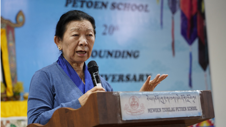
ཕྱི་ལོ་ ༢༠༢༥ ཟླ་ ༡༠ ཚེས་ ༡༠ ཉིན་མེས་དཔོན་གཙུག་ལག་དཔེ་སློབ་སློབ་གྲྲ་དབུ་བརྟེན་ནས་ལོ་རྩི་ ༣༠ ཉིན་པོ་འཁོར་བའི་དུས་ཚེན་སྲུང་བཅིའི་ཚོགས་སྤྱི་མཐོན་གཙོ་བོར་ཕེབས་པ།

མཚོག་གིས་ཚོགས་མང་འཚམས་འདྲི་དང་སྤྱད་སྤྱོད་གསུང་བཤད་གནང་དོན། ཕྱི་ལོ་ ༡༩༥༩ ལོར་རྒྱ་ནག་དམར་གཞུང་གིས་བོད་མི་ཡོངས་ཚོགས་བཅོམ་བཟུང་དབང་བསྐྱར་བྱས་ཆེས། བོད་མིའི་སྤོངས་ལོ་རྩི་དབུ་ཁྲིད་སྤྱི་ཚོགས་ལ་ལོ་རྩི་ལྟར་མཐོན་ཚེན་པོ་མཚོག་གིས་དབུ་བརྟེན་པའི་བོད་མི་ཁྲི་ཚོ་བརྒྱུད་སྤྱད་ཅམ་བཅོམ་བྱོལ་ལ་ཕེབས་དགོས་བྱུང་བ་དང་། དེ་ཡང་སྤྱི་ཚོགས་ལ་ལོ་རྩི་ལྟར་མཐོན་ཚེན་པོ་མཚོག་གི་ཚུལ་ཚེན་གྱི་དགོངས་གཞི་ལོག་བོད་པའི་སློབ་གྲྲ་ལྟར་འཇུག་ས་ཡོང་ཐབས་སྐོར་སྤྱད་པའི་རྒྱ་གར་གྱི་སྲིད་ཚོལ་ལེ་ཏུ་མཚོག་ལ་ལུས་ཆེས། རྒྱ་གར་གཞུང་ནས་མཐུན་འཇུག་གནང་བའི་ཚོགས་བཅོམ་བྱོལ་ནང་བོད་པའི་སློབ་གྲྲ་ཁག་ལྟར་འཇུག་ས་ལྱིས་བོད་ཀྱི་སྤྱད་ཡིག་གཙོ་བོར་བྱུང་བའི་ལྗན་མོང་མ་ཡིན་པའི་ཚོས་དང་། རིག་གཞུང་རྒྱུན་འཛིན་གནང་སྲུབ་པ་བྱུང་བ་མ་ཟད། དེར་དུས་ཀྱི་ཕྱི་ལོ་ལོན་སློབ་སློབ་བྱ་རྒྱུའི་གོ་སྐབས་བྱུང་ཡོད། བོད་སྤྱད་ཚུལ་ལྱི་ཕྱི་ལོ་ལོན་སློབ་སློབ་གི་མཐུན་ཚུལ་ཡང་རིམ་བཤ་ཡང་རྒྱས་ཕྱིན་ཏེ་ད་ལྟའི་སྤྱད་སྤྱོད་སྤྱད་སྤྱོད་སྤྱད་ཚུལ་ལ་ཕྱི་ལོ་ལོན་མཐུན་ཚུལ་ཏེ་ཅང་འཛོམས་པོ་ཡོད་པ་སོགས་བཅོམ་བྱོལ་ནང་ཚོགས་མང་སློབ་གྲྲ་གསར་