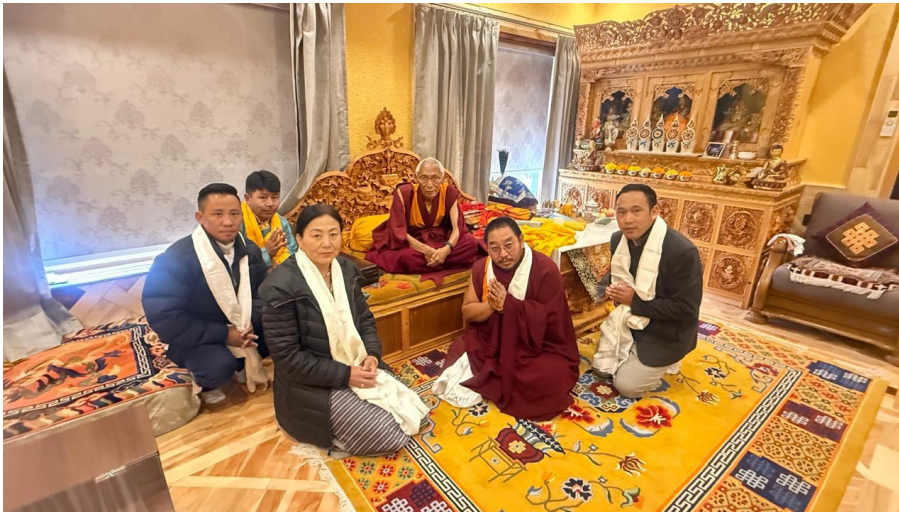
ཕྱི་ལོ་ ༢༠༢༥ ཟླ་ ༡༠ ཚེས་ ༣ ཉིན་སྤྱི་འཕུས་འཇུ་ཆེན་དགོན་མཚོག་ཚོས་སྟོན་མཚོག་དང་སྤྱི་འཕུས་མཁའ་པོ་ཀའི་ཕྱག་དངོས་བྱུང་བ་ཤོད་ ནས་མཚོག་རྣམ་གཉིས་ནས་ཤ་སྐྱབས་རྗེ་ཞིག་ཚེ་རིན་པོ་ཆེ་མཚོག་མཇུག་འཕྲད་ཞུ་སྐབས།