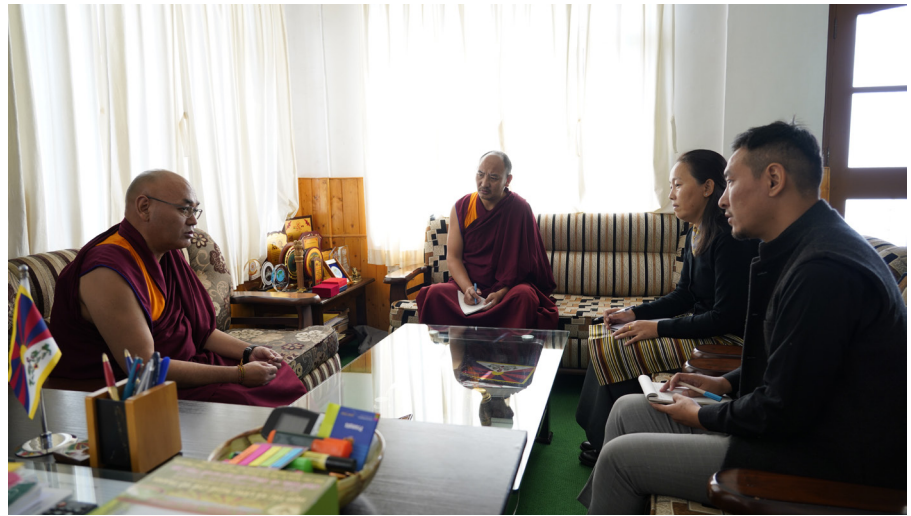
ཕྱི་ལོ་ ༢༠༢༥ ལྷ་ ༡༠ ཚེས་ ༢༦ ཉིན་སྤྱི་ཁྱབ་ཅིས་ཞིབ་ལས་ཁང་གི་ཅིས་ཁང་ལོ་ ༢༠༢༥ ལྷ་ ༢༦ ལོའི་སྤྱི་ཁྱབ་ཅིས་ཁང་ཞིབ་འཇུག་ཚོགས་ཚུངས་གི་ ལྷན་ལས་དོན་སྤྱི་ཁྱབ་ཅིས་ཁང་ཞིབ་ལས་ཁང་གི་ཅིས་ཁང་ལོ་ ༢༠༢༥ ལྷ་ ༢༦ ལོའི་སྤྱི་ཁྱབ་ཅིས་ཁང་ཞིབ་འཇུག་ཚོགས་ཚུངས་གི་ལས་དོན་དབྱུང་འཇུག་གཞན་བ།

༢༠༢༥ ལྷ་ ༢༦ ལོའི་སྤྱི་ཁྱབ་ཅིས་ཁང་ཞིབ་འཇུག་ ལོའི་ཚོགས་ཚུངས་གི་ལྷན་ལས་དོན་སྤྱི་ ཁྱབ་ཅིས་ཁང་ཞིབ་འཇུག་ལོ་ལོ་ དེ་ཡང་བཅའ་ཁྲིམ་བོད་མིའི་ གཞི་དབྱུང་འཇུག་ལོ་ལོ་ལོ་ལོ་ ལོ་ལོ་ སློབ་ཅིས། དབྱུང་ཅིས་སྤངས་འཕྲོད་བཅས་ གི་སྤྱི་ཁྱབ་ཅིས་ཁང་ཞིབ་འཇུག་ ༡༠ པའི་ནང་གསལ་ ༢ པའི་དགོངས་དོན་ལྟར། སྤྱི་ཁྱབ་ཅིས་ ཞིབ་ལས་ཁང་གི་ཅིས་ཁང་ཅིས་ཞིབ་འཇུག་ ལོའི་ཚོགས་ཚུངས་གི་ལོ་ལོ་ ༡) སྤྱི་འཇུག་ སློབ་དཔོན་ལྷན་བསྐྱེད་རྒྱུ་ལ་མཚན་མཚོག་ དང་། ༢) ལེས་རིག་ལས་ཁུངས་ཀྱི་དབྱུང་ གཞན་ལྷན་བཞུགས། ༣) འཕྲོད་བསྟེན་