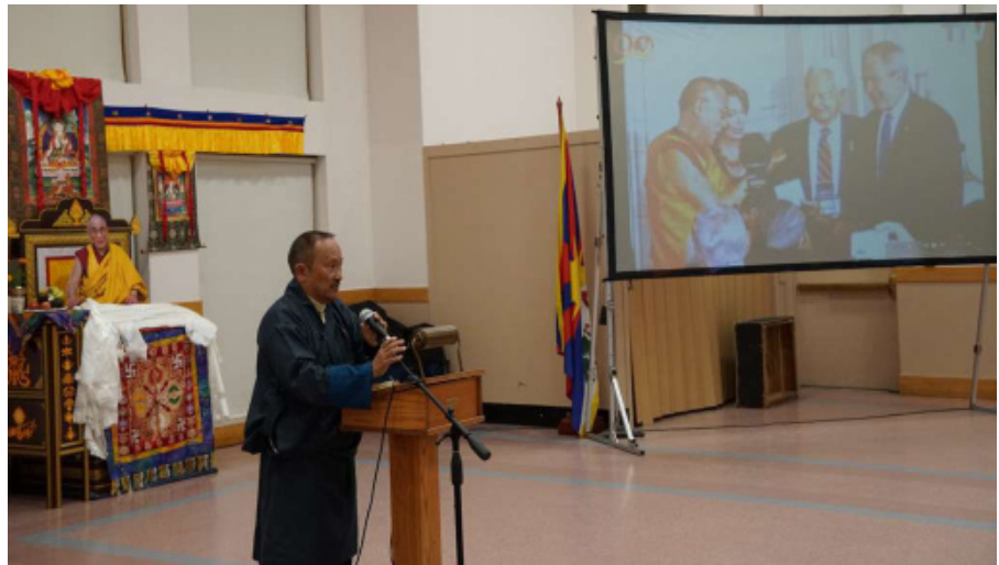
ཕྱི་ལོ་ ༢༠༡༥ ལྷ་ ༡༠ ཚེས་ ༡༥ ཉིན་ཨ་རིའི་མེ་ས་ཚུ་སེཌ་གོང་ཁྲིའི་ཨམ་ཉེ་སི་ (Amherst) དུ་རྟེན་གཞི་བྱས་པའི་ཡི་ཤུའི་ལྷ་ཁང་ Redeemer Church རྒྱ་སྤྱི་ནོར་ཡ་གོང་ས་ཡ་སྐབས་མགོན་ཆེན་པོ་མཚོག་ལ་ཨ་རིའི་གྲོས་ཚོགས་ནས་གསེར་གྱི་གཞེངས་རྟགས་འབྲུལ་བཞེས་མཇུག་ བྱས་མི་ལོ་ ༡༥ འཁོར་བའི་དུས་རྒྱུན་སྲུང་བཙུག་ཞུས་པར་ཕྱི་ལོ་ལྷ་ཁང་གི་ཨ་རིའི་གྲོས་ཚོགས་བཞུགས་པའི་མེ་ས་ཚུ་སེཌ་གོང་ཁྲིའི་ མཚོག་ནས་གསུངས་པ་ལྟར་གནང་སྐབས།

སི་ (Amherst) དུ་རྟེན་གཞི་བྱས་པའི་ཡི་ ཤུའི་ལྷ་ཁང་ Redeemer Church རྒྱ་སྤྱི་ རིའི་མེ་ས་ཚུ་སེཌ་ས་གནས་བོད་རིགས་སྤྱི་ མཐུན་ཚོགས་པའི་གོ་སྐྱིག་འོག་སྤྱི་ནོར་ ཡ་གོང་ས་ཡ་སྐབས་མགོན་ཆེན་པོ་མཚོག་ ལ་ཨ་རིའི་གྲོས་ཚོགས་ནས་གསེར་གྱི་ གཞེངས་རྟགས་འབྲུལ་བཞེས་མཇུག་ནས་ མི་ལོ་ ༡༥ འཁོར་བའི་དུས་རྒྱུན་སྲུང་བཙུག་ བྱས་པར་ཕྱི་ལོ་ལྷ་ཁང་གི་ཨ་རིའི་གྲོས་ཚོགས་བཞུགས་པའི་མེ་ས་ཚུ་སེཌ་གོང་ཁྲིའི་ མཚོག་ནས་གསུངས་པ་ལྟར་གནང་སྐབས།