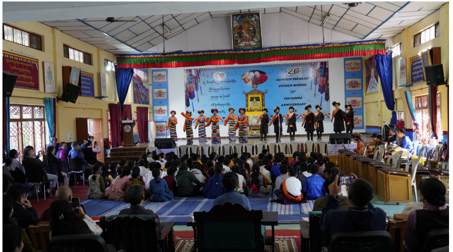
ཕྱི་ལོ་ ༢༠༡༥ ལྷ་ ༡༠ ཚེས་ ༡༠ ཉིན་མེས་དཔོན་གཞུག་ལག་དཔེ་རྟོན་སློབ་བྱ་དབུ་བརྟེན་ནས་ལོ་ངོ་ ༡༠ ཉིན་པོ་འཁོར་བའི་དུས་ཚོན་སྤྱད་ བཅི་སྐབས་ཀྱི་མང་། མེས་དཔོན་གཞུག་ལག་དཔེ་རྟོན་སློབ་བྱའི་སློབ་སྤྲུལ་རྣམས་གཞན་སྤྱ་འཐབ་སྟོན་གཞིགས་འདུལ་ཞུས་སྐབས་

འཛིན་རིམ་གཞིར་བཟུང་རིག་ གཞུང་གཞན་སྤྱ་འཐབ་སྟོན་གཞིགས་ འདུལ་ཞུས་གནང་འདུག།