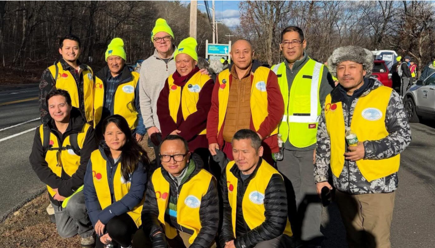
ཕྱི་ལོ་ ༢༠༢༥ ལྷ་ ༡༡ ཚེས་ ༢༥ ཉེན་ཨ་འི་མེ་ས་ཚུ་སེཾ་བོད་རིགས་སྤྱི་མཐུན་ཚོགས་པའི་བོད་ཀྱི་རྒྱ་ཁག་ནས་ཐེངས་དང་པོར་སྐབས་ ༡༦ པའི་ལོ་འཁོར་ Food Bank ལོམ་བཟོད་ནང་ཨ་འི་མེ་ས་ཚོགས་འོག་མའི་འབྲུས་མི་སྤྱི་ཞབས་རིམ་ མེག་ལྷོ་མཉན་ (Jim McGovern) མཚོགས་དང་། བྱང་ཨ་འི་མེ་སྤྱོད་པ་བཞུགས་པོད་མི་མང་སྤྱི་འབྲུས་དོན་གྲུབ་ཚེ་རིང་མཚོགས་རྣམ་གཉིས་ནས་མཉམ་ཞུགས་གནང་སྐབས།

ཚོགས་ལ་ལེགས་སྐྱེས་སུ་ལ་བ་ཞིག་རེད་ ཅེས་གསུངས་འདུག མེ་ས་ཚུ་སེཾ་བོད་ རིགས་སྤྱི་མཐུན་ཚོགས་པའི་ཚོགས་གཙོ་ ཡོན་ཉན་རྒྱ་མཚོ་ལགས་ཀྱིས། ཐེངས་ འདིའི་ལས་འགུལ་ནང་བོད་ཀྱི་རྒྱ་ཁག་ནས་ མ་དདུམ་ཨ་སྐོར་ ༤༠༠༠ མ་ཐེན་ཅམ་ བསྐྱ་རུབ་དང་། ལོམ་བཟོད་ཉེན་གཉིས་ པའི་སྤྱི་དོན་ཞལ་ལག་མཐུན་འགྱུར་ཞུས་ ཡོད། ས་གནས་མི་མང་དང་ལྷན། ད་ལན་ ལས་འགུལ་འདིའི་ནང་བོད་མི་ཉི་ལྷུ་ལྷག་ ཅམ་ཀྱིས་མཉམ་ཞུགས་གནང་ཡོད། དེ་ནི་ སྤྱི་ལོར་ཡགོང་ས་ཡསྐབས་མགོན་ཆེན་པོ་ མཚོགས་ཀྱི་བཀའ་སྐོར་ལམ་སྟོན་ལག་བསྟར་ གནང་བ་ཞིག་དང་། མེ་ས་ཚུ་སེཾ་ས་ གནས་ལ་བཀའ་དྲིན་རྗེས་བྱུང་ཞུས་པ་ མཚོན་གྱི་ཡོད་ཅེས་གསུངས་འདུག ལོམ་