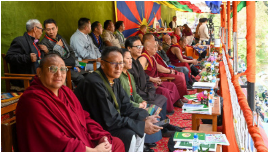
ཀྱི་ལོ་ ༢༠༡༤ ལྷ་ ༡༠ ཚེས་ ༡༣ ཉིན་དེ་སྤྱོད་འོད་སྤྱི་གུ་ལྷིད་ལྷོ་དབུ་བརྒྱུས་ཏེ་མི་ལོ་ ༤༥ ལྷི་ལོ་འཁོར་པའི་དུས་དྲན་སྤོང་བཅོམ་མཚན་སྤོང་ གནང་བའི་ལྷ་ལྷན་འོད་མི་མང་སྤྱི་འཕུས་ལྷན་ཚོགས་ཀྱི་ཚོགས་ཆེད་མེས་གནང་བ།

སྤྱོད་པོང་སྤེལ་གཏོང་བཞིན་ཡོད་པ་ལྟར་སྤྱི་ གནས་སོགས་སྤྱི་ཚུལ་འདྲ་མེན་གྱི་ཚོགས་ བས་སྤྱོད་སྤོང་ཆེད་འབད་བཅོམ་གང་ལུ་ གནང་དང་གནང་སྤུས་དེ་ལྟར་ཡང་། རྒྱ་ དམར་གཞུང་གིས་འོད་ལྡན་འོད་མི་རིགས་ ཀྱི་འོ་མོ་ཅ་བརྒྱལ་གཏོང་རྒྱུ་ལྷིད་བྱས་ རོག་འོད་ཀྱི་སྐད་ཡིག་སློབ་སྦྱོང་དང་བཀོལ་ སྤྱོད་ཚོགས་ལ་དམ་འཇགས་ཆེ་བྱ་བཏང་དང་ གཏོང་བཞིན་པས་མ་ཚད། འོད་མི་མང་ པོར་ཉེས་མེད་བཅོམ་འཇུག་དང་བཀག་ཉར་ གྱིས་མི་སྤྱོད་ལས་འདས་པའི་དུས་གཞིའི་ ལྷ་ཚོགས་བྱས་ཏེ་དཔུལ་བ་མི་ཡུལ་དུ་ འཕོས་པ་ལྟ་བུའི་སྤྱི་ཚོགས་སྤོང་དང་ གཏོང་བཞིན་ཡོད། སློབ་སྦྱོང་ཚོར་མཚོན་ བ་སྤྱི་གུ་ལོ་བཞི་ཟེན་ཅམ་ནས་པ་མ་དང་ཁ་ བུལ་བཏང་སྤེལ་མ་དང་སྤྱི་གུའི་འདོད་པ་ མེད་བཞིན་དུ་རྒྱ་ནག་དམར་གཞུང་གིས་ བཅོམ་དབང་ཚོགས་ནས་འོད་སྤྱི་གུ་ས་ཡ་ གཅིག་ལྷག་བཅའ་སྤོང་སློབ་སྤྱོད་བཅུག་ དང་འཇུག་བཞིན་ཡོད། བཅའ་སྤོང་སློབ་ གུའི་ནང་འོད་ཀྱི་སྐད་ཡིག་དང་། ཚོས་རིག་ གཞུང་བཅས་སྤོང་རྒྱུའི་ཤོ་སྤྱོད་མེད་པ་ རྒྱ་སྐད་བཅོམ་དབང་འོག་སྤོང་དགོས་པ་ བཅོས་ཚོགས་ལོ་ནས་ལོར་མཐུན་སྤྱི་གུ་ ལྷམས་སོ་སོའི་པ་མ་དང་ཁ་བུལ་ནས་སྤོང་ དགོས་དུས་འོད་མི་རིགས་ཀྱི་ཡུལ་གོམས་ གཞིས་ལུགས་མེད་པ་བཅོས་ཏེ་འོད་སྤྱི་གུ་ རྒྱ་སྤྱི་གུ་སྤྱོད་རྒྱུའི་སྤྱི་དབྱས་དཔུལ་ལག་ བསྐྱར་བྱེད་བཞིན་ཡོད། ང་ཚོ་རང་དབང་