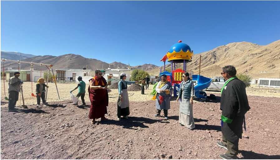
ཕྱི་ལོ་ ༢༠༢༡ ཟླ་ ༥ ཚེས་ ༢༡ ཉིན་སྤྱི་འབྲུས་འདུ་ཆེན་དགོན་མཚོག་ཚོས་སྤྱོད་མཚོག་དང་སྤྱི་འབྲུས་མཁན་པོ་ཀའ་བླ་གྲོ་དངོས་ལྟུང་བསོད་ནམས་མཚོག་རྣམ་གཉིས་ནས་ལ་དུགས་བྱང་ཐང་རུ་མ་ཁུལ་གྱི་བོད་ཁྱིམ་གཞི་རིམ་སྤྱི་ལོ་ཁོང་ཕྱེས་སོགས་ལ་གཞིགས་སྟོན་གནང་སྐབས།