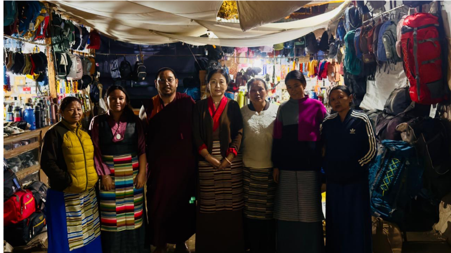
སྤྱི་ལོ་ ༢༠༢༡ ཟླ་ ༩ ཚེས་ ༢༦ ཉེན་སྤྱི་འཐུས་འཇུ་ཆེན་དགོན་མཚོག་ཚོས་སློབ་མཚོག་དང་སྤྱི་འཐུས་མཁའ་པོ་ཀའི་གྲག་དངོས་སྤྱོད་པའི་ནས་མཚོག་རྣམས་གཉིས་ནས་དཀར་སྟེང་ཞེས་པའི་སྤྱི་བོ་ཚུ་ཚོད་ལྷན་ལ་གཞིགས་སྐོར་ཕེབས་གནང་སྐབས།

སྤྱི་ཚེས་ ༢༦ ཉེན་གྱི་སྤྱི་བོ་ཚུ་ཚོད་ ༡༠།༣༠ ཐོག་བཞུགས་གནས་ལྷོ་ན་གར་མཐོན་ཁང་ནས་ཕེབས་ཐོན་གནང་སྟེ། ཉེན་ཚུབ་ཚུ་ཚོད་ ༡།༣༠ ཅམ་ལ་ (kargil War Memorial) སྤྱི་ལོ་ ༡༩༩༩ ལས་ ༡༩༩༩ བར་དཀར་སྟེང་ཞེས་པ་བོད་དམག་མང་པོའི་ཆེ་སྟོག་ཤོར་བའི་ལོ་རྒྱུས་ལྷན་པའི་ས་གནས་དེར་ཕེབས་འགྲུར་མཚམས། གཞིགས་སྐོར་དང་། ཞོར་དུ་སློབ་