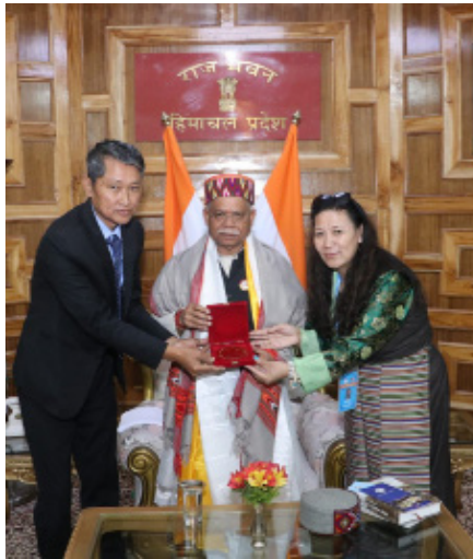
ཕྱི་ལོ་ ༢༠༢༥ ལྷོ་ ༡༠ ཚེས་ ༧ ཉིན་བོད་མི་མང་སྤྱི་འཐུས་ལྷན་ཚོགས་ཀྱི་གོ་སྐྱོད་ལོག་ཡུལ་བའི་གོ་སྐྱོན་དང་བྲམས་བརྗེའི་ལོ་སྤྱོད་བརྗེ་སྤྱོད། ཚོགས་ཁྱེད་ལས་ཁྱེད་ཀྱི་ལས་བྱེད་འགྲེམས་སྐྱོན་ཚོགས་ཚུང་ཞིག་ནས་སིམ་སྤྱི་ལྷག་རྩེ་ཐང་ཆེན་ (Shimla Gandhi Maidan, Gaiety Theater) ལྷོ་སྤྱི་ཐོང་ཡུལ་གྱི་ཡུལ་སྐོར་མཐོན་ཆེན་པོ་མཚོག་གི་ཐུགས་བསྐྱེད་དམ་བཅའ་བཞེས་དང་། ཡུལ་སྐོར་མཚོག་གིས་གསོལ་སྐུལ་གནང་བའི་བོད་མིའི་མང་གཙོ་ཞེས་པའི་བརྗོད་གཞིའི་ཚོག་པར་རིས་འགྲེམས་སྐྱོན་དབུ་འབྱེད་མཛད་སྤྱོད་སྐྱོ་མཐོན་གཙོ་བོ་ཡུལ་སྐོར་ཆེ་སྐྱབས་རྗེ་སྐྱབས་ལུང་ཚེ་སྐུལ་རིན་པོ་ཆེ་མཚོག་གི་ཡང་སྤྱོད་མཚོག་སྐུལ་རིན་པོ་ཆེ་མཚོག་ནས་དབུ་བྱེད་གནང་སྐབས།

ལྷོ་མོ་ལགས་རྣམ་གཉིས་ནས་ཉི་མ་ཅལ་མངའ་སྡེའི་སྤྱི་སྤྱོད་ལོག་གི་ལྷོ་ལྷོ་ལྷོ་ལྷོ་ (Shiv Pratap Shukla, Governor of Himachal Pradesh) མཚོག་མཛེས་འབྲས་དཔྱད་ལོག་ལྷོ་ལྷོ་ལྷོ་ལྷོ་