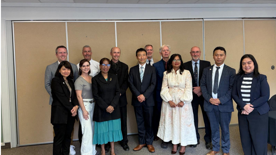
ཕྱི་ལོ་ ༢༠༢༥ ལྷ་ ༡༡ ཚེས ༡༢ རྣམ་ ༡༤ བར་ནིུ་ཇི་ལན་ཏེ་རྒྱལ་ས་ ཇི་ལིང་ཀོན་ (Wellington) རྒྱ་ཨེ་ཤེ་ཡ་ཞི་བདེ་རྒྱ་མཚོའི་ཁྲུལ་གྱི་བདེ་འཇགས་ཚོགས་འདུ་ (Asia Pacific Security Innovation Forum) ཞིག་གོ་སྤྲིན་ཞུས་པའི་ཐོག་ཨོ་སི་ཀོ་ལི་ཡའི་ཕྱོགས་བཞུགས་སྤྱི་འཐུས་དོ་རིང་བསྐྱོད་འཛིན་ཕུན་ཚོགས་མཚོག་ཨེ་ཤེ་ཡ་ཞི་བདེ་འཇགས་གནང་སྐབས།

མཚོག་མཉམ་ཞུགས་ཀྱིས་གཏམ་བཤའ་དང་ལས་རིམ་ནང་ཆེད་མཁས་བཞེས་ཡོད་འདུག དེ་ཡང་སྤྱི་འཐུས་མཚོག་ནས་ཚོགས་འདུའི་ཐོག་རྒྱལ་སྤྱིའི་ནང་འབྲེལ་ལམ་གནང་ཕྱོགས་ཀྱི་ཐབས་བྱས་དང་འབྲེལ་བའི་ཐོག་ Economic Diplomacy VS Strategic Presence ཞེས་པའི་བརྗོད་གཞིའི་ཐོག་གཏམ་བཤའ་དང་བཟོ་སྲིད་གི་ཆེད་མཁས་བཞེས་ཏེ། བཅོམ་སྤྱོད་འོད་མིའི་སྤྱི་གཞུགས་སྐོར་དོ་སློབ་དང་། བོད་དོན་གཙོ་གནད་ཐོག་གོང་གསལ་བརྗོད་གཞི་དང་འབྲེལ་བའི་གཏམ་བཤའ་དང་། སུ་ཚུན་བཟོ་སྲིད་གནང་འདུག་བརྗོད་གཞི་དེའི་ཐོག་སྤྱི་འཐུས་མཚོག་དང་ལྷན་ཞུ་བའི་ལམ་ཁྲུལ་གྱིས་ཚོགས་འདུས་མི་ལྷན་པ་དང་། བོད་དོན་རྒྱལ་སྐྱོར་བ་སྤྱི་ཞབས་སི་མོན་ཨོ་ ཀོ་ལོར་ (Simmon O'Connor Former MP, New Zealand) མཚོག་དང་། འི་ལྷན་པ་ལས་ཏེ་ (Timor-Leste) ཡི་གཞུང་ཚབ་ཆེན་མོ་ཨེ་ཤེ་ལ་ཏེ་ རོ་ཏེ་རི་རྣམ་ལོ་ (HE Idelta Rodriguez) མཚོག་ནས་གཉིས་ཡིན་འདུག