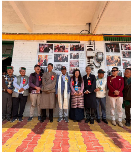
ཕྱི་ལོ་ ༢༠༢༥ ལྷ་ ༡༠ ཚེས་ ༢ ཉིན་བོད་མིའི་མང་གཙོ་འབྲུས་ལྷན་ཚོགས་ཀྱི་གོ་སྐྱོད་འོག་ཡུལ་བའི་གོ་སྟོན་དང་བྱམས་བརྗོད་ལོ་སྤྱད་བཅའ་བྱུང་ཚོགས་ཀྱི་ལས་བྱེད་འབྲེམས་སྟོན་ཚོགས་ཚུང་ཞིག་ནས་སིམ་ལ་སོ་རྩོལ་གྲོ་ལོར་ཕྱི་ལོར་ཡགོང་ས་ཡུལ་མགོན་ཆེན་པོ་མཆོག་གི་ཕྱགས་བསྐྱེད་དམ་བཅའ་བཞི་དང་། ཡགོང་ས་མཆོག་གིས་གསོལ་སྐུལ་གནང་བའི་བོད་མིའི་མང་གཙོ་ཞེས་པའི་བརྗོད་གཞིའི་ཐོག་བར་རིས་འབྲེམས་སྟོན་དབུ་བཟུང་མཛད་སྤྱིའི་སྐུ་མགོན་གཙོ་བོ་ཉི་ལ་ཅལ་མངའ་སྡེའི་ཁལ་བསྐྱེད་ཚོན་ཆེན་སྐུ་ཞབས་རྣམས་ལྷན་ཅི་སྟེ་ (Shri Jagat Singh Negi, Minister of Revenue and Horticulture, HP) མཆོག་ནས་གནང་སྐྱེལ་།

ནོར་ཡགོང་ས་ཡུལ་མགོན་ཆེན་པོ་མཆོག་གི་ཕྱགས་བསྐྱེད་དམ་བཅའ་བཞི་དང་། ཡགོང་ས་མཆོག་གིས་གསོལ་སྐུལ་གནང་བའི་བོད་མིའི་མང་གཙོ་ཞེས་པའི་བརྗོད་གཞིའི་ཐོག་བར་རིས་འབྲེམས་སྟོན་ཞིག་གོ་སྐྱོད་ཀྱིས་ཡོད་པ་རེད།