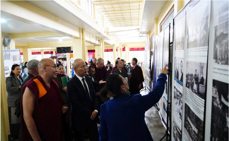
སྤྱི་ལོ་ ༢༠༢༤ ཟླ་ ༤ པའི་ཆེས་ ༩ ཉིན་བཞུགས་སྤྱང་ན་རས་ས་ལ་ཐོག་ཆེན་ཆོས་སྲིད་གཙུག་ལག་ཁང་གི་ཆོས་རའི་ནང་ཡ་གོང་ས་མཆོག་གིས་གསོལ་སྐུལ་གནང་བའི་བོད་མིའི་མང་གཙོ། ཞེས་པའི་བརྗོད་གཞིའི་ཐོག་པར་རིས་འབྲེམས་སྟོན་གནང་རྒྱབས།

༡༧ །སྤྱི་ཚོར་ཡ་གོང་ས་ཡ་སྐྱབས་མགོན་ ཆེན་པོ་མཆོག་གི་ཐུགས་ལྷུང་དགྲུང་ གངས་ ༤༠ ལ་མེབས་པའི་ཡ་སྐྱེའི་འཇུངས་ རྒྱུད་དང་བརྟུན། བོད་མིའི་སྤྱི་གཞུགས་ བས་ལོ་འཁོར་མོ་བྱམས་བཅའི་ལོ་ཞེས་ སྤྱང་བཅེ་ཞུ་བཞིན་ཡོད་པ་ལྟར། དེ་སྤྱི་ ལོ་ ༢༠༢༤ ཟླ་ ༡༢ པའི་ནང་རྒྱ་གར་རྒྱལ་ ས་སྤྱི་ལིར་ཐབས་བྱས་ཚོགས་འདུའི་ རྒྱབས། ཡ་སྐྱེའི་གོ་སྟོན་དང་བརྟུན་བྱམས་ བཅའི་ལོ་སྤྱང་བཅེའི་ལས་རིམ་དང་འབྲེམ། བོད་མི་མང་གཙོ་འབྲུས་རྣམས་ནས་མང་