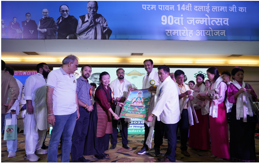
ཕྱི་ལོ་ ༢༠༢༥ ལྷ་ ༩ ཚེས་ ༡༥ ཉེན་རྒྱ་གར་རྒྱལ་ཡོངས་བཅོད་བྱོལ་བོད་མིའི་ཚོང་པ་ཚོགས་པའི་གོ་སྐྱོལ་འོག་ རྒྱ་གར་མན་ཇབ་མངའ་སྡེའི་ འུ་རྩེ་ལ་ན་གྲོང་སྡེའི་ (King Place) ཚོགས་ཁང་ནང་སྤྱི་ནོར་ཡུལ་ས་ཡ་སྐབས་མགོན་ཆེན་པོ་མཚོག་གི་ཡ་སྐུའི་གོ་སྐྱོན་དང་འབྲེལ་བྱམས་ པ་ཚོའི་ལོ་སྤྱད་བཅེ་རྒྱས་སྐབས།

ནམས་ལག་ལེན་བསྐྱར་རྒྱ་ལི་ཡ་སྐུའི་ འཇུངས་སྐར་གྱི་ལེགས་སྦྱེས་ངོ་མ་ཞིག་ ཆགས་གྱི་ཡོད་སྟོར་སོགས་གསུངས་སོང་། གཞན་ཡང་མཇོང་སྟོའི་ཐོག་ དཔལ་ལྷན་སྲིད་སྟོར་མཚོག་དང་། རྒྱ་གར་ ལྷ་སྐྱ་ཚོགས་པ་ཁག་གི་ཚོགས་གཙོ་ཁག་ ཅིག་ནས་གསུང་བཤད། བཅོད་བྱོལ་བོད་ མིའི་ཚོང་པ་ཚོགས་པའི་ཚོགས་གཙོ་ བསོད་ནམས་སྟོབས་རྒྱལ་ལགས་ནས་ འཚམས་འདྲིའི་གསུང་བཤད། བོད་ཀྱི་སློབ་ གར་ཚོགས་པ་དང་། གཞས་པ་གཞས་མ་ ཁག་ཅིག་ནས་བོད་དང་། རྒྱ་གར་གྱི་གཞས་ སྐྱ་གཞིགས་འབྲུལ། ཚོགས་གཞོན་བསོད་ ནམས་དོན་ལྷན་ལགས་ནས་ཐུགས་རྗེ་ཆེ་ ཞུའི་གསུང་བཤད་བཅས་གནང་སོང་བ་ བཅས།