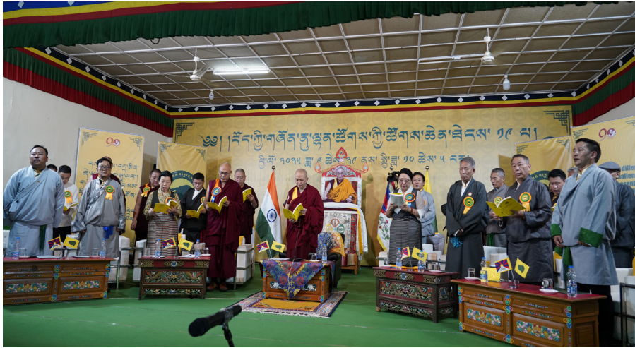
ཕྱི་ལོ་ ༢༠༢༡ ཟླ་ ༤ པའི་ཚེས་ ༢༤ ཉིན་དེའོད་བོད་ཁྱིམ་སློབ་གྲུའི་ཚོགས་ཁང་དུ་ཉིན་གྲངས་བདུན་པའི་བོད་ཀྱི་གཞིན་ལུ་ལྷན་ཚོགས་ཀྱི་ ཚོགས་ཆེན་ཐེངས་ ༡༥ པའི་དབུ་འབྱེད་སྐབས་།