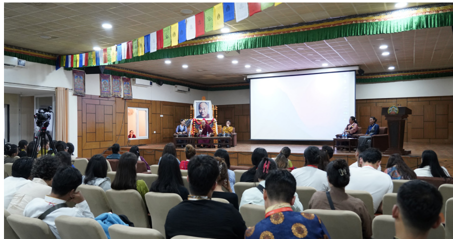
ཕྱི་ལོ་ ༢༠༢༥ ལྷ་ ༩ ཆེས་ ༡༠ ཉིན་གངས་སྤྱིད་སྤྱིད་སྤྱིད་ཚོགས་ཁང་ནང་དཔལ་ལྷན་ཁྲིམས་ཞིབ་པ་ཆེ་བ་མཚོག་དང་། དཔལ་ལྷན་བོད་མི་ མང་སྤྱི་འཐུས་ཚོགས་གཙོ་མཚོག་དཔལ་ལྷན་སྤྱིད་སྤྱིད་མཚོག་བཅས་ནས་བརྟན་བཞུགས་ཐོག་ཕེབས་པའི་རྒྱལ་སྤྱིའི་བོད་ཀྱི་གཞིན་སྤྱིས་ རྣམས་དང་ལྷན་ཐུག་འཕྲད་གནང་སྐབས།

མང་སྤྱི་འཐུས་ཚོགས་གཙོ་མཚོག་པོ་བསོད་ ནམས་བསྟན་འཕེལ་མཚོག་ དཔལ་ལྷན་ སྤྱིད་སྤྱིད་སྤྱིད་བ་ཆེ་བའི་མཚོག་བཅས་ ནས་བརྟན་བཞུགས་ཐོག་ཕེབས་པའི་རྒྱལ་ སྤྱིའི་བོད་ཀྱི་གཞིན་སྤྱིས་རྣམས་དང་ལྷན་ ཐུག་འཕྲད་ཀྱིས་གསུང་བཤད་དང་། དེ་བ་ དེས་ལན་གྱི་ལས་རིམ་བསྐྱུངས་གནང་སོང་།