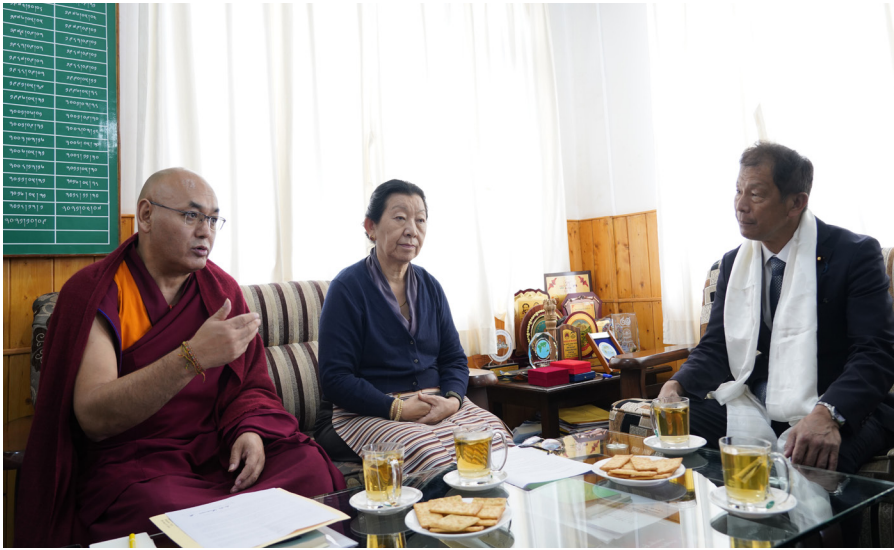
ཕྱི་ལོ་ ༢༠༢༥ ཟླ་ ༤ ཚེས་ ༢ ཉིན་དབུས་ལྷན་ཚོགས་གཙོ་སྡེའི་པོ་མཚོ་གཞི་གཉིས་ཚོགས་གཙོའི་ལས་ཁུངས་སུ་ཉི་འོང་གྲོས་ཚོགས་འཐུས་མི་ སྤྱི་ཞབས་མཇུ་ཕུ་ཚེ་རྫོང་ (Wada Yuchiro, House of Representative) མཚོག་དང་ལྷན་མཇུག་འཕྲད་སྐབས།

ཉི་འོང་ལ་ཆེབས་བསྐྱུང་བསྐྱེད་པའི་སྐོར་ དང། ཉི་འོང་གྲོས་ཚོགས་བོད་དོན་རྒྱུ་ སྐྱོར་ཚོགས་པ་ནི་གྲོས་ཚོགས་བོད་དོན་ རྒྱུ་སྐྱོར་ཚོགས་པ་ཆེ་ཤོས་ཤིག་ཡིན་སྐོར་ སོགས་ཉི་འོང་དང། བོད་པའི་དབང་གྱི་ འབྲེལ་བའི་སྐོར་ལ་གསུངས་རྗེས། བོད་ དོན་ཐོག་སྤྱི་མཐུན་རྒྱུ་སྐྱོར་གནང་རྒྱུའི་ འཕོད་སྐུལ་བཅས་ལྟུང་གནང་སོང།