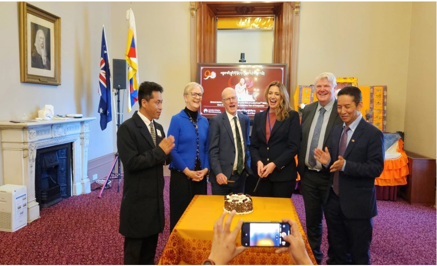
ཕྱི་ལོ་ ༢༠༢༥ ཟླ་ ༥ ཚེས་ ༡༣ ཉིན་ཨོ་སི་ཁྲོ་ལི་ཡ་མིག་གོ་རི་ཡའི་གྲོས་ཚོགས་གོང་མའི་ནང་ལས་ལུགས་འཕུལ་སྤྲོད་ལ་བརྟེན་པའི་ ལྷན་པ་ཚོའི་མཇུག་ཁ་ལྷན་ལྷན།

གཞན་ཡང་མཇུག་སྡེའི་ཐོག་སྤྱི་ འཐུས་མཚོག་གིས་བོད་མི་མང་སྤྱི་འཐུས་ ལྷན་ཚོགས་ཀྱི་ཚབ་ཁུལ་ཉེ་མངའ་སྡེའི་ གྲོས་ཚོགས་འཐུས་མིའི་བོད་དོན་རྒྱབ་སྐྱོར་ ཚོགས་པའི་རྒྱུད་སྤེལ་ཚོགས་གཙོ་རྣམས་ གཉིས་ལ་ལེགས་མོའི་བྲག་རྟགས་ཕྱེས་པ་ དང་། ས་གནས་བོད་རིགས་ཚོགས་པ་ནས་ གྲོས་ཚོགས་འཐུས་མི་རྣམས་ལ་ལ་གོང་ས་ མཚོག་གིས་བརྒྱུ་ལས་གནང་བའི་བྲག་དེབ་ བོད་དང་བོད་མིའི་མཁྱིམ་ཚབ་ (Voice for the Voiceless) ཅེས་པ་བྲག་རྟགས་སུ་