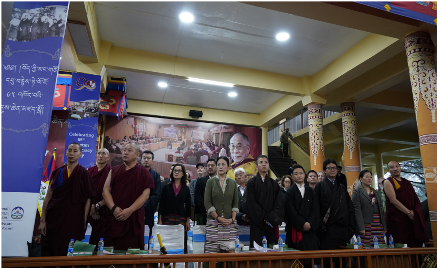
ཕྱི་ལོ་ ༢༠༢༥ ལྷོ་ལྗེ་ས་ ༩ ཉེན་བཞུགས་སྐྱེད་རྩལ་ས་ལ་མེག་ལྷན་གཙུག་ལག་ཁང་གི་མདུན་ཐང་དུ་བོད་མིའི་མང་གཙོ་དབུ་བརྒྱུས་ནས་མི་ལོ་ ༦༥ ཉེན་འཁོར་བའི་གཞུང་འབྲེལ་དུས་ཚོན་སྐྱེད་རྩལ་སྐོར་མཛད་སྒྲིལ་གྱི་མི་མང་གྲུབ་ལས་རྣམས་ལ་ཚེད་བཅར་གནང་སྐབས།

འོས་འདེམས་བྱས་པའི་འགོ་འཁྲིད་ཚོར་ བསྐྱེད་ཏེ། དེ་དག་གཞིས་བྱེས་བོད་མི་ ཡོངས་ཀྱི་ངོ་ཚབ་དང་སྤྱི་ལྷན་སྐྱེད་པའི་རྣམས་ ལ་ལྷན་ལ་ཞིག་ཏུ་བསྐྱེད་གནང་མཛད་དེ་ མང་གཙོའི་ལམ་སྟོན་གསུང་སྤྱོད་དང་ བོད་ཀྱི་བདེན་པའི་འཕམ་ཚོད་རྒྱུན་སྐྱོད་ ལྷུས་དང་ལྷ་བཞིན་ལ་ཞི་དགའ་སྐྱོབས་འོས་ ལ་ཞིག་ཏུ་གྱུར་ཡོད།