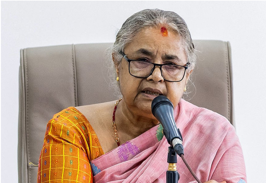
བལ་ཡུལ་གྱི་སྲིད་ཚོམ་ལྷམ་སྐྱ་སྐུ་ལི་ལ་ཀར་གི་ (Sushila Karki) མཚོག

ལ་མང་ཚོགས་ཀྱིས་ཡིད་ཆེས་ཆེན་པོ་ གནང་གི་ཡོད་པ་གསལ་པོར་མཚོན་ཐུབ། བོད་དང་། བལ་ཡུལ་གཉིས་ དབར་དུས་རབས་མང་པོའི་རིང་གི་ཚོས་ ལྷོགས་དང་། རིག་གཞུང་། ལོ་རྒྱུས་ཀྱི་ འཕེལ་བ་གཉིད་ཟབ་ཡོད་པ་དང་། ལྷག་ བར་དུ་འདས་པའི་ལོ་མང་རིང་བལ་ཡུལ་ གཞུང་མང་གཉིས་ནས་ས་གནས་སྐྱ་ གནས་སྲོད་བོད་མི་རྣམས་ལ་མཐུན་འགྱུར་ གནང་བར་ཐུགས་རྗེ་ཆེ་ལྷུ་ལྷུ་ཡིན། ལྷག་ ལྷོད་དེ་ལ་བརྟེན་ནས། བལ་ཡུལ་ནང་ གནས་སྲོད་བོད་མི་ཚོས་བོད་ཀྱི་སྲོལ་རྒྱུན་ རིག་གཞུང་རྒྱུན་འཛིན་གནང་ཐུབ་པ་མ་ ཟད། སྤྱི་ཚོགས་སྤྱི་ལའང་བཟང་ལྷོགས་ཀྱི་ ལུས་པ་འདོན་སྲུབ་པ་བྱུང་ཡོད།