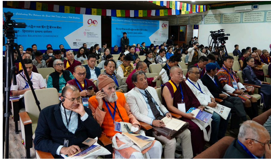
ཕྱི་ལོ་ ༢༠༢༢ ལྷན་ཚོགས་ ༩ ཉན་བཞུགས་སྐབས་དང་མ་གངས་སྤྱིད་སྲིད་སྐོར་ཚོགས་ཁང་ནང་ཉན་གྲངས་ལྗེ་རིང་གི་བོད་དང་ཉི་མ་ ལ་ཡའི་འབྲེལ་ལས་སྐོར་གྱི་ཚོགས་ཚེན་དུ་འབྱེད་མཛད་སྤྱིའི་སྐབས།

ཁ་གསུམ་གྱི་ས་ཁྱོད་ལས་བཟལ་ཉེ་རྒྱ་ རིགས་གནས་སའི་ས་ཆ་དང་། ཡུ་རོབ། ཞེ་ཤི་ཡ་ས་ཁུལ་མང་པོར་དར་ཁྲུབ་ཚེན་པོ་ བྱང་ཡོད་པ་ལོ་རྒྱུས་ཀྱི་གནས་བབ་ཐོག་