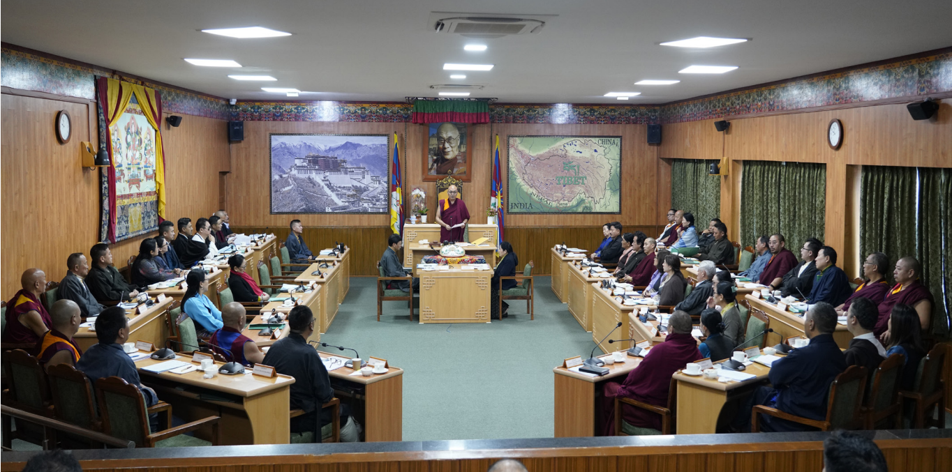
ཕྱི་ལོ་ ༢༠༡༥ ལྷ་ ༤ ཚེས་ ༡༠ ཉིན་སྐབས་ ༡༩ པའི་བོད་མི་མང་སྤྱི་འཐུས་ལྷན་ཚོགས་ཀྱི་གྲོས་ཚོགས་ཚོགས་དུས་བཅུ་པའི་ཐོག་དཔལ་ལྷན་ཚོགས་གཙོ་མཛོག་གིས་བཤད་ཀྱི་བཤད་ཀྱི་མཛོག་གིས་ཚོགས་ འདུ་དབུ་འཇུག་མཁུ་གསུང་བཤད་གནང་སྐབས་།

༡༢། །ལྷ་བཅས་སྤོང་ཞིང་གཞུག་ལྷོ་གཞུག་གི་ འཛིག་ཉེན་ཞི་བའི་དེད་དཔོན། །ལམས་ གསུམ་ཚེས་ཀྱི་ལྷལ་པོ། །བོད་མི་ཡོངས་ཀྱི་ ལྷ་ལྷོ་ལེན་པའི་དབུ་འཇུག་སྤྱི་ཚོར་ལྷོང་ས་ ལྷ་བས་མཐོན་ཆེན་པོ་མཚོག་ལ་སྤོ་ གསུམ་གུས་ལྷལ་སྤོན་དུ་སྤུལ་བའི་ཐོག་ ལས། དེ་རིང་སྐབས་བཅུ་བདུན་པའི་བོད་མི་ མང་སྤྱི་འཐུས་ལྷན་ཚོགས་ཀྱི་གྲོས་ཚོགས་ ཚོགས་དུས་བཅུ་པའི་ཐོག་མེབས་པའི་ དཔལ་ལྷན་སྤོང་མཚོག་དང་། །བཀའ་ ལྷོན་ལས། །དཔལ་ལྷན་ཚོགས་གཙོ་ གཞུག་པ་མཚོག་དང་། །བཀའ་འོས་ཀྱིས་ ཚོགས་ཀྱི་འཐུས་མི་རྣམས་ལ་ཚང་མར་ཐོག་ མར་ཚོགས་གཙོ་མཛོག་པོ་ལྷོང་ལོང་གིས་ འཛིང་བཀའ་ལེན་པའི་ལེགས་ལྷ་ལྷོ་ཡིན། དེ་རིང་རྒྱ་ལྷོན་གསལ་ ལྷོང་། བོད་མི་མང་སྤྱི་འཐུས་ལྷན་ཚོགས་ལོ་ གཞུག་ལ་ཐེངས་མ་གཉིས་འཚོགས་ཀྱི་ ཡོད་པའི་ཕྱི་ལྷོ་གསུམ་པའི་གྲོས་ཚོགས་དེ་ ལྷོན་ཅིས་དང་། །ཕྱི་ལྷོ་དབུ་ལ་དེ་ལས་ བསྤོམས་གྲོས་ཚོགས་ཞེས་དེ་རིང་རྒྱ་ལྷོན་ ལས་བསྤོམས་གྲོས་ཚོགས་འཚོགས་ལྷོང་ དུས་ཚོད་དེ་འཁེལ་བསྤྲད་ཡོད་པའི་གཙོ་ མོ་ལས་ཉེན་མང་ཆེ་བ་དེ། །ལྷོན་ལང་ལག་གི་ ལས་བསྤོམས་ལྷོན་ལ་དེ་སྤོན་སྤྱི་འཐུས་ ལྷོན་ལས་ལ་ལྷོན་གནང་ནས་སྤྱི་འཐུས་ ལྷོན་ལས་ཀྱིས་དེར་བསྐྱུང་ཞིབ་བྱས་ནས་ དེའི་མེས་འབྲས་ལ་སྤོན་ཐོང་བའི་བཤག་ ཅིག་ལེབས་ཡོང་གི་ཡོད་པའི་དེ་གཞུག་ བཞེན་ལྷོན་ལང་སོ་སོའི་ངོས་ནས་ལས་ བསྤོམས་བསྐྱུང་བ་ཐད་ཀར་གྲོས་ཚོགས་ ལང་ལ་སྤོན་སྤོན་ལྷོན་ལྷོན་གནས་སྤོངས་ཀྱི་ ཐོག་ནས་དེ་རིང་གི་གྲོས་ཚོགས་ཕྱི་ལྷོ་ ༤