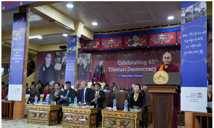
ཕྱི་ལོ་ ༢༠༡༥ ཟླ་ ༩ ཚེས་ ༢ ཉིན་བཞུགས་སྐྱོད་རམ་ས་ལ་མེག་རྩན་གཞུག་ལག་ཁང་གི་སྤྱོད་ཐང་དུ་བོད་མིའི་མང་གཙོའི་དབུ་བརྟེན་ནས་མི་ལོ་ ༤༥ ཉེས་པོ་འཁོར་བའི་གཞུང་འབྲེལ་དུས་ཚེན་སྤྱོད་ཐོག་དཔལ་ལྷན་ཚོགས་ཀྱི་གསུང་བཤད་སྤྱི་གནང་བཞིན་པ།

སྐབས་དེ་དུས་དགུང་གྲངས་བཅུ་དྲུག་ལས་སོན་མེད་ཀྱང་། ཕྱི་ལོ་ ༡༩༥༠ ཟླ་ ༡༡