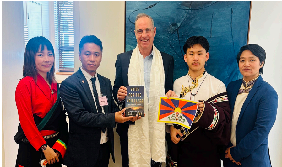
ཕྱི་ལོ་ ༢༠༡༥ ལྷ་ ༤ ཚེས་ ༡ རྣམ་ ༢ བར་ཉིན་གངས་གཉིས་རིང་ཨོ་སི་ཀྲོ་ལི་ཡའི་བོད་དོན་ལུན་ཚོགས་ (Australia Tibet Council) གྱིས་ བོད་དོན་ལུ་སྐལ་གྱི་ཉིན་མོ་གོ་སྐྱེག་ལུས་པའི་ཚོགས་པེབས་ལུ་གསུངས་བོད་མི་མང་ཕྱི་ལུས་རྩོམ་སྐྱོད་བསྐྱོན་འཛིན་ལུན་ཚོགས་མཚོགས་མཉམས་ ལུ་གསུངས་ཕྱི་ལོ་ཨོ་སི་ཀྲོ་ལི་ཡའི་ལུ་གསུངས་ཕྱི་ལོ་ཨོ་སི་ཀྲོ་ལི་ཡའི་ལུ་གསུངས་ཕྱི་ལོ་ཨོ་སི་ཀྲོ་ལི་ཡའི་ལུ་གསུངས་ཕྱི་ལོ་ཨོ་སི་ཀྲོ་ལི་ཡའི་ལུ་གསུངས་

གནང་མཁན་སྐུ་ཚབ་གཉིས་ཀྱིས་བོད་དོན་ ལུ་སྐལ་སྐྱོར་རྩོམ་སྐྱོད་དང་། བོད་ནང་གི་རྩོམ་ སྐྱོར་གནས་སྐབས་འབྲེལ་བཟུང་། ཨོ་སི་ཀྲོ་ ལི་ཡའི་ཚོགས་པེབས་ལུ་མིའི་བོད་དོན་ལུ་སྐལ་ ཚོགས་པའི་ལུ་སྐལ་ཚོགས་པའི་གཙུག་ལྷན་ ལུ་ཡུལ་བོད་དོན་སྐྱོར་རྩོམ་སྐྱོད་གསུང་ བཤམ་དང་། བཅའ་འཛིན་ལན་འདེབས་ གསལ་བཤམ་གནང་འདུག དེ་རྗེས་དེམ་པས་ཉིན་གཉིས་ཀྱི་ རིང་ཨོ་སི་ཀྲོ་ལི་ཡའི་ཚོགས་པེབས་ལུ་ མི་གངས་ ༣༠ ཅམ་དང་མཇལ་སྐྱོད་ཀྱིས་ བོད་དོན་སྐྱོར་ལུ་སྐལ་གནང་ཞིང་། ལྷན་ དབང་སྐུ་སྐྱོར་ཡང་སྐྱོད་རིང་འཛིན་གྱི་ ཚོགས་པེབས་ལུ་འགན་དབང་རྒྱ་ལའི་སྐུ་ཚབ་ གངས་ལུ་འགན་འཛིན་རྣམས་ལ་ཡོད་པ་ ལས་རྒྱ་ནག་གཞུང་ལ་སྐུ་ཚབ་ཀྱི་ལུ་