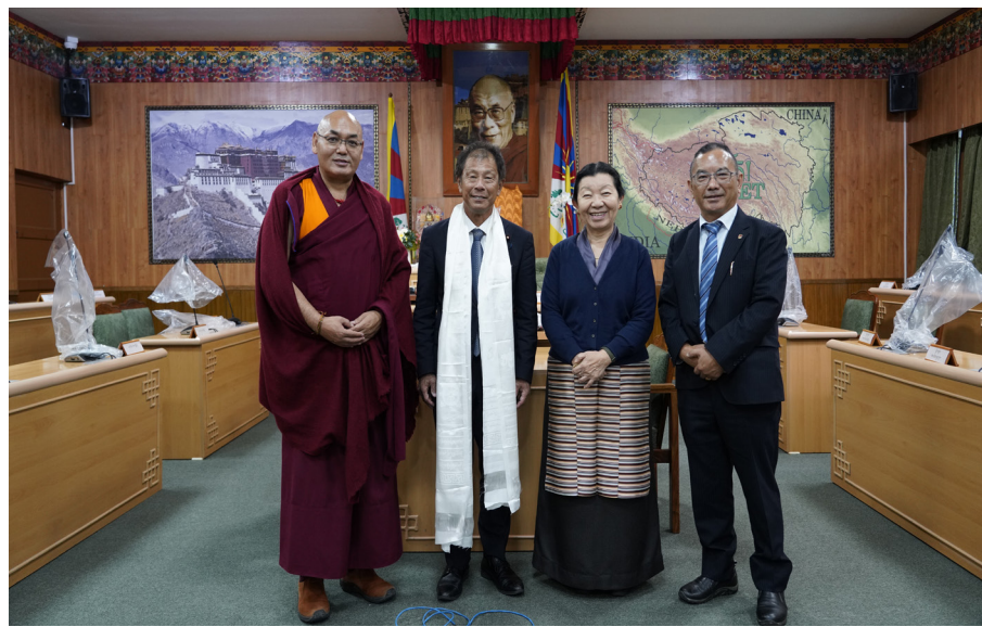
ཕྱི་ལོ་ ༢༠༢༥ ལྷ་ ༤ ཚེས་ ༢ ཉིན་ཉི་འོང་ཕྱོས་ཚོགས་འཐུས་མི་སྐུ་ཞབས་ཁྲ་དུ་ ཡུ་ཆི་རྫོ་ (Wada Yuchiro, House of Representative) མཆོག་བོད་མི་མང་སྤྱི་འཐུས་ལྷན་ཁང་དུ་པེབས་སྐབས།

གནས་སྐབས་དང་། བཅོན་ཁྲོལ་བོད་མིའི་ མང་གཙོའི་འཕེལ་རིམ་སོགས་ཀྱི་ཐོག་ བཀའ་བསྟར་དང་། ཉི་འོང་ཕྱོས་ཚོགས་ནང་ བོད་དོན་དང་འབྲེལ་བའི་ཕྱོས་ཚོད་སོགས་ འཛོག་གནང་ཡོང་བའི་འབོད་སྐུལ་ལྷུས་ གནང་སོང་།