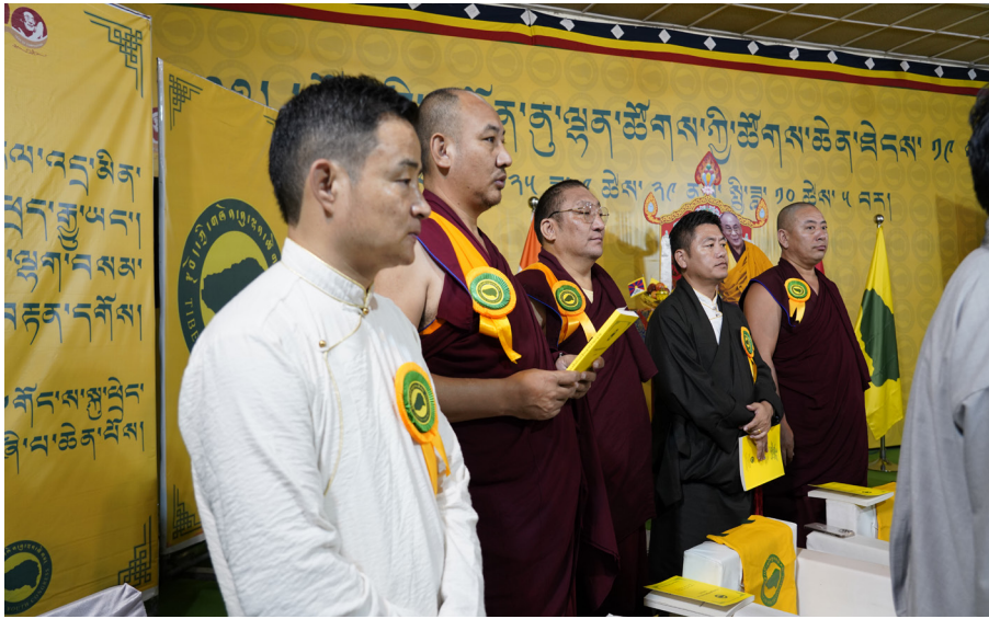
ཕྱི་ལོ་ ༢༠༢༥ ཟླ་ ༥ པའི་ཚེས་ ༢༩ ཉིན་རྩོད་ཐོད་ཐོན་ཁྲིམ་སྤྱོད་ཐོད་ཚོགས་ཁང་དུ་ཉིན་གཅིག་གི་ཐོད་ཐོན་གྱི་གཞིན་ལུ་ལྷན་ཚོགས་ཀྱི་ ཚོགས་ཚེན་ཐངས་ ༡༤ པ་དབུ་འཕུལ་སྤྲོད་སྤངས་།

སྤྱི་ལོ་ལྷོ་མི་ཚོགས་འཕུལ་ལྷན་ཚོགས་ཀྱི་ཐོད་ཐོན་རྒྱུ་ སྤྱོད་ཚོགས་ཚེན་ཐངས་བརྒྱུད་པ་དེ་ཨ་མི་ རྒྱལ་ས་མ་ཡིང་འོན་པ་ཚོགས་པ་ནས་ བརྒྱུད་དེ་བར་རྒྱ་དམར་གཞུང་ལ་གཏོང་ ལེན་གྱི་མཁའ་སྤྲིན་འཕུལ་ལྷན་ཚོགས་ལིན་ཀའང་ འབྲ། ཚད་དང་ལྷན་པ་སྤྱི་ལོ་ལྷོ་མི་ཚོགས་ མཉམ་སྦྲེལ་གྱི་དགོས་ཀྱི་འདུག མཉམ་ སྦྲེལ་གྱི་རྒྱུ་དཀའ་ངལ་མི་འདུག འོ་ཚོ་ ཡང་རྒྱ་དམར་གཞུང་གི་སྤྱི་དབུས་འཛིན་ ལྷན་ལ་འདོད་པ་མེད་པར། ར་ཚོ་མཉམ་ ཏུ་འགྲོ་མི་སྲུབ་པ་གང་ཡང་མི་འདུག འོང་ ཚོ་ལའང་སྤྲིན་འཕུལ་སྤངས་དང་། རྗེས་འཇུག སྤྱི་ཚོགས་ཤིག་ཡོད་དུས། ར་ཚོ་མཉམ་ སྦྲེལ་གྱི་ཚོགས་པ་རྒྱ་དམར་གཞུང་གི་སྤྱི་ དབུས་ལ་འཇུག་པ་གཏོང་སྲུབ་རྒྱུར་ཐབས་ ཤེས་གང་ཡོད་མེད་ཐོག་དགོངས་པ་བཞེས་ སྲུབ་དགོས་རྒྱ་དེ་གལ་ཚེན་པོ་གཅིག་པེད་ འདུག ར་ཚོ་སྤྱི་ཚོགས་ནང་གོ་རྟོགས་ སྦྲེལ་བ་གང་ཞིག་ལ་སྤྱི་ཚོགས་གཞན་གྱི་ བང་ལའང་དེ་ལྟར་གོ་རྟོགས་སྦྲེལ་ནས་ཐོད་ ཐོན་ཐོག་རྒྱུ་སྤྱོད་སྤྲོད་སྲུབ་ཐབས་ཀྱི་ རྒྱ། དེ་བཞིན་སྤྱི་དུལ་ལས་ཁུངས་ཀྱི་ཐོག་ ལས་མི་མང་དུས་མའི་ནང་ནས་ཐོད་ཐོན་ ཐོག་རྒྱུ་སྤྱོད་གཞན་མཁའ་འདུ་འཛོམས་ གིས་ཐོད་ཐོན་རྒྱུ་སྤྱོད་ཚོགས་ཚེན་ཞིག་ བསྐྱོར་ཚོགས་གཞན་གྱི་ཡོད་པེད། དེ་སྤྱི་ ལོ་ ༢༠༢༥ ཟླ་ ༢ པའི་ནང་ལྷོ་ལོ་སྤྲོད་ འཇམ་རྒྱལ་ས་སྤྱོད་མིལ་ལ་ཚོགས་པ་པེད། སྤྲོད་པ་དེ་དུས་རྒྱལ་ཁབ་ ༩༠ ཅམ་ནས་