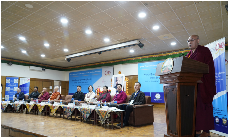
ཕྱི་ལོ་ ༢༠༢༥ ལྷ་ ༤ ཚེས་ ༣ ཉིན་བཞུགས་སྐྱོར་དྲ་རམ་ས་ལ་གངས་སྐྱོད་མིང་སྐྱོད་ཚོགས་ཁང་ནང་ཉིན་གྲངས་ལྔའི་རིང་གི་བོད་དང་ཉི་མ་ ལ་ཡའི་འབྲེལ་ལམ་སྐོར་གི་ཚོགས་ཆེན་དབུ་འབྲེད་མངོན་སྐོར་གསུང་བཤད་གནང་བཞིན་པ།

༢༣། ཕྱི་ལོ་ ༢༠༢༥ ལྷ་ ༤ ཚེས་ ༣ ཉིན་སྤྱོད་བཞུགས་སྐྱོར་དྲ་རམ་ས་ལ་ གངས་སྐྱོད་མིང་སྐྱོད་ཚོགས་ཁང་ནང་ཉིན་ གྲངས་ལྔའི་རིང་གི་བོད་དང་ཉི་མ་ལ་ཡའི་ འབྲེལ་ལམ་སྐོར་གི་ཚོགས་ཆེན་དབུ་ འབྲེགས་གནང་སོང་། སྐབས་དེའི་དབུ་འབྲེད་མངོན་ སྐོར་སྐུ་མགོན་གཙོ་བོར་བོད་མིའི་སྤྱི་ག་ འབྲེགས་ཀྱི་དཔལ་ལྷན་མིང་སྐྱོད་མེན་པ་ཆེ་ རིང་མཚོག་དང་། དམིགས་བསལ་སྐུ་ མགོན་དུ་དཔལ་ལྷན་བོད་མི་མང་སྤྱི་འཇུག་