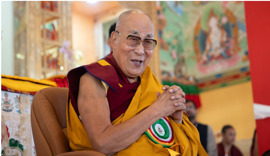
བོད་མིའི་རྒྱ་ན་མེད་པའི་དབུ་འཁྲིད་སྤྱི་ནོར་ཡལོང་ས་ཡ་སྐབས་མགོན་ཆེན་པོ་མཚོག