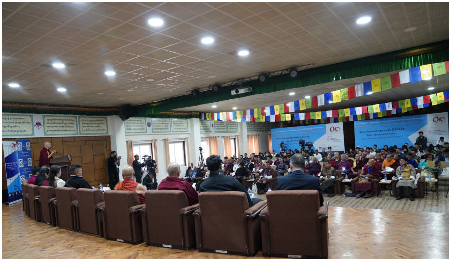
ཕྱི་ལོ་ ༢༠༡༥ ལྷ་ ༤ ཚེས་ ༣ ཉིན་བཞུགས་སྐྱོད་དྲམ་ས་ལ་གངས་སྐྱོད་སྐྱོད་ཚོགས་ཁང་ནང་ཉེན་མངས་ལྷེ་ལེ་གི་འོད་དང་ཉི་མ་ལ་ཡའི་འབྲེལ་ལམ་སྐོར་གྱི་ཚོགས་ཆེན་དུ་འབྱུང་མཛད་སྤྱི་ལོ་སྐབས།

བལྟས་ཡོང་དུས། ཆབ་སྲིད་དང་ལོ་རྒྱུས་ཀྱི་ འབྲེལ་བ་ཡོད་པའི་དངོས་པོ་གང་དང་གང་ ཡིན་ནའང་། བར་ཚོས་ཀྱི་ཐོག་ནས་བཤད་ པ་ཡིན་ན། འགྲུང་བ་སྐད་ཅིག་མའི་གནས་ ལྟངས། ཉམ་པ་བཏུབ་པ་སྲུ་གཅིག་གིས་ ཤེས་མ་ཐུབ་པའི་གནས་སྟངས། རང་ བཞིན་གྱི་འགྲུང་བ་འགྲོ་བསྐྱེད་པའི་གནས་ ལྟངས་ཆགས་ཡོད་ཅེད། འོད་ཀྱི་ཆབ་སྲིད་ ཀྱི་གནས་བབ་ཐོག་ལ་ཡིན་ནའང་། ལྐབས་ དེ་དུས་ཀྱི་འགན་ཁུར་མཁན་ཅེད། འབྲེལ་ ཡོད་ཚང་མས་དོ་སྣང་ཚུང་སྐྱོན་དང་། འགན་ཁུར་བཞེས་སྟངས་ཐོག་ནས་ཚགས་ ཚུད་པོ་མ་བྱུང་བའི་རྒྱུ་རྐྱེན་དང་ཚོ་བཅོན་ རྒྱུ་ལ་གྱུར་དགོས་བྱུང་བ་དེ་ས་རིས་ཐང་ གསལ་ཅེད། འོད་ཅེས་པ་དེ་བཅོན་པོའི་ རྒྱལ་རབས་མཉམ་འབྲེལ་བསྐྱེད་པའི་དུས་ཚོད་ ལས་འོད་ནང་སེལ་བྱ་མང་པོ་ཆགས་བསྐྱེད་