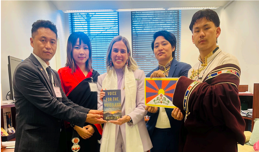
ཕྱི་ལོ་ ༢༠༡༥ ལྷ་ ༥ ཚེས་ ༡ རྩིས་ ༡ བར་ཉིན་གྲངས་གཉིས་ཤིང་ཨོ་སི་གྲོ་ལི་ཡའི་བོད་དོན་ལྷན་ཚོགས་ (Australia Tibet Council) ཀྱིས་ བོད་དོན་ལྷན་སྐྱེས་ཀྱི་ཉིན་མོ་གོ་སྐྱོད་ལྷན་པའི་ཐོག་གྲོ་ས་ཚོགས་པོང་མའི་འཕུས་མི་མང་སྤྱི་འཐུས་དོ་རིང་བསྟན་འཛིན་ལུག་ཚོགས་མཚོགས་མཚོགས་ ལྷན་ཚོགས་ཀྱིས་ཨོ་གླིང་གྲོ་ས་ཚོགས་འཕུས་མི་ལོགས་མཇལ་འཕྲད་གནང་སྐབས།

བོང་མའི་འཕུས་མི་ Senator Dean Smith མཚོགས་གྲོ་ས་ཚོགས་པོང་མའི་ འཕུས་མི་ Senator Nick Mckim མཚོགས་ གྲོ་ས་ཚོགས་པོང་མའི་འཕུས་མི་ Senator Steph Hodgins-May མཚོགས་བཅས་ ཀྱིས་ཨོ་གླིང་གྲོ་ས་ཚོགས་སུ་བོད་དོན་སྐོར་ སློང་སློང་དང་། བོད་དོན་ལྷན་སྐྱེས་སྐབས་རེ་ འབོད་ལྷན་པའི་དོན་ཚན་ཁག་ཅིག་གི་ཐོག་ གསུངས་འདུག