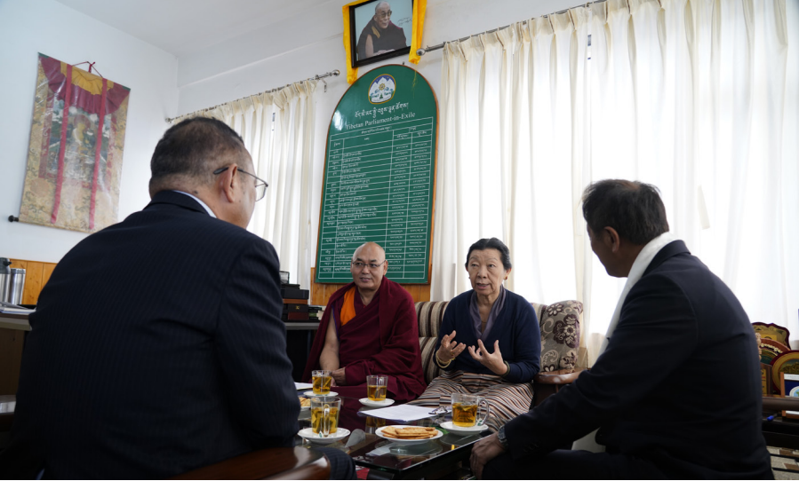
ཕྱི་ལོ་ ༢༠༢༥ ཟླ་ ༤ ཚེས་ ༢ ཉིན་དབུས་ལྷན་ཚོགས་གཙོ་སྡེའི་པོ་མཚོ་གཞི་གཉིས་ཚོགས་གཙོའི་ལས་ཁུངས་སུ་ཉི་འོང་གྲོས་ཚོགས་འཐུས་མི་ སྤྱི་ཞབས་མཇུ་ཕུ་ཚེ་རྫོང་ (Wada Yuchiro, House of Representative) མཚོག་དང་ལྷན་མཇུག་འཕྲད་སྐབས།

བརྒྱུད་ད་བར་འཛུགས་བ་རི་བྱུང་སྐོར་དོ་སྲོད་ སྤྱིད་བསྐྱུས། སྤྱི་ནོར་ཡལོང་ས་ཡ་སྐབས་ མགོན་ཆེན་པོ་མཚོག་རྒྱ་གར་ལ་བཅོམ་ ཁྲོལ་དུ་ཕྱེབས་རྗེས། སྤྱིའི་རྒྱལ་ཁབ་ཐོག་གས་