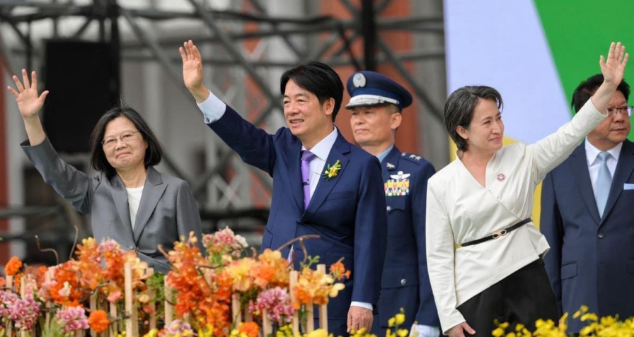
ཕྱི་ལོ་ ༢༠༢༤ ལྷོ་ ༥ ཚེས་ ༢༠ ཉིན་ཐལ་ཕན་གྱི་སྐབས་ ༡༦ པའི་ཕྱི་འཛིན་གསལ་བསྐྱོར་བཅས་ Lai Ching-te མཚོག་དང་། ཕྱི་འཛིན་གཞིན་པ་ལུ་མ་ Hsiao Bi-Khim མཚོག་རྣམས་གཉིས་ལས་ཁྲུང་དབུ་འཇུག་མཛད་སྟོ་འཛིན་སྐབས།