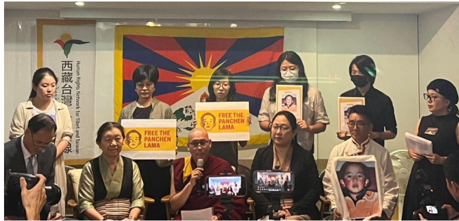
ཕྱི་ལོ་ ༢༠༢༠ ལོའི་ ༥ ཚེས་ ༡༥ ཉེན་ཐའེ་ཐོག་འགྲོ་བའི་ཐོག་ཐའེ་ཐོག་ཚོགས་པ་གཙོ་བོ་ལའི་གཞུང་ཁོངས་མིན་པའི་ཚོགས་པ་ཁག་ནས་གོ་སློག་ ཞུས་པའི་ལ་གྲན་གཞིགས་པ་ཏེ་ཆེན་མཆོད་རློང་མིང་པོ་ཆེ་མཚོ་གཤིས་རྣམས་ལ་ཞུ་བའི་བཅའ་ལྟར་ལེགས་པའི་འཕྲིད་གཞུང་ལོང་ཆ་མེད་དུ་གྱུར་ནས་མི་ལོ་ ༡༤ འཁོར་བའི་ཏུ་ཐོག་གསར་འགོད་གསལ་བསྐྱོགས་གནང་བའི་མཛེན་སྤྱིའི་སྐབས་ལ།