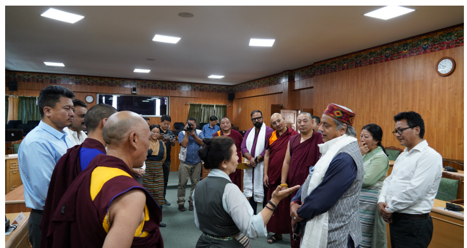
ཕྱི་ལོ་ ༢༠༢༤ ལྷ་ ༥ པའི་ཚེས་ ༣༠ ཉེན་ལྷན་ལྷན་ཁྲིམས་ཚོགས་ཡོག་མའི་འཇུག་མི་དང་། ལྷན་ཁྲིམས་གཞུང་གི་ཕྱི་སྲིད་ཚོན་ཆེན་ཟུར་པ་སྐུ་ཞབས་པོ་ལི་ཐ་རུར་ (Dr. Shashi Taroor) མཚོག་པོ་དང་མི་མང་སྤྱི་འཇུག་ལྷན་ཁང་དུ་ཕེབས་སྐབས་ལ།

སྐབས་དེར་དཔལ་ལྷན་པོ་ལི་ཐ་རུར་སྤྱི་འཇུག་ཚོགས་གཞོན་སྐོར་པ་མེ་དེར་མཚོག་གིས་གཙོ་སྤྱི་འཇུག་ལྷན་ལས་ཚོགས་ལྷན་པ་དང་། མང་ཚོགས་ཚེས་ཁྲིམས་