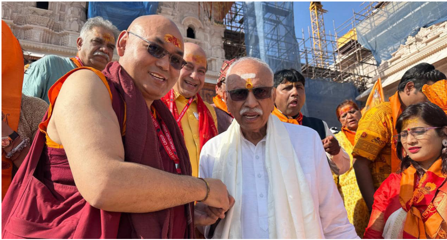
ཕྱི་ལོ་ ༢༠༡༩ ལྷ་ ༧ པའི་ཚེས་ ༢༡ ཉིན་དཔལ་ལྷན་ཚོགས་གཙོ་མཚོག་ཉེན་རྒྱུ་ལྷ་ཁང་ཨ་ཡོ་རྒྱ་ རྒྱལ་མན་རྟེན་ (Ayodhya Ram Mandir) ལ་གནས་མཇུག་ལེགས་སྐྱབས།

ལྷ་གས་གནང་ཡོད་པ་དང་། ཕྱི་ཚེས་ ༢༡ ཉིན་གྱི་སྤྱོད་གནས་མཚོག་ཨ་ཡོ་རྒྱ་ རྒྱལ་མན་རྟེན་ (Ayodhya Ram Mandir)