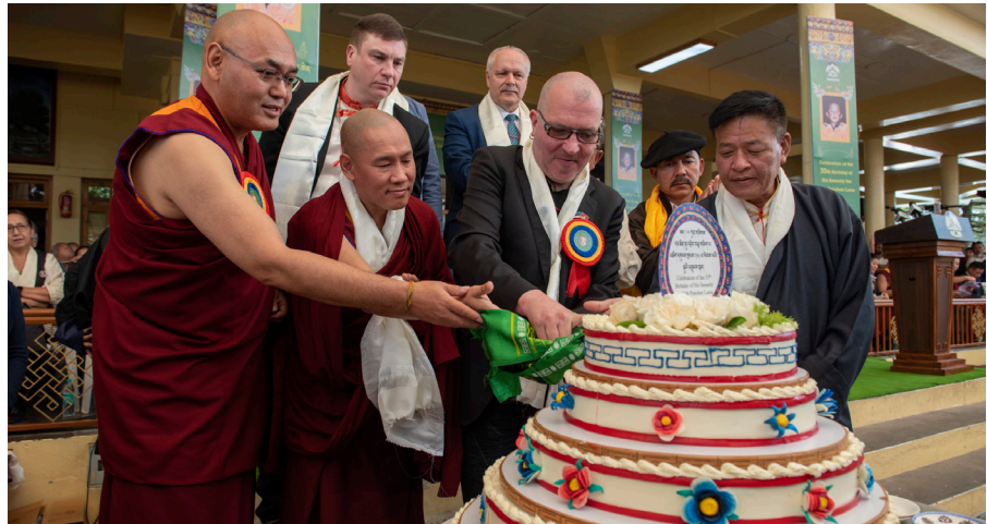
གྱི་ལོ་ ༢༠༡༩ ལྷ་ ༩ པའི་ཚེས་ ༢༥ ཉེན་ཀྱན་གཞིགས་ཡུལ་ཆེན་རིན་པོ་ཆེ་སྐྱུ་ལྷེད་བཅུ་གཅིག་པ་ཇི་བཅོན་བསྐྱོན་འཛིན་དགོ་འདུན་ཡི་ཤེས་ འཕྲིན་ལས་བྱུན་ཚོགས་དཔལ་བཟང་པོ་མཚོག་དགུང་གངས་ ༢༥ ལ་མེབས་པའི་ལྷ་སྐུའི་འཁྲུངས་སྐྱེད་མཛད་སྒོ་འཛིན་སྐབས་།

ཡང་སྲིད་སྐྱུ་ལྷེད་བཅུ་གཅིག་པ་ མཚོག་དགུང་གངས་རྒྱལ་ནས་རྒྱ་ནག་ དམར་གཞུང་གིས་བཅོན་ཁྲིད་གྱིས་གང་ སོང་ཆ་མེད་དུ་བཏང་ནས་ད་ཆ་ལོ་རྒྱུ་ ༡༩ ལོར་ཞིང་། དེ་ནི་འཛམ་གླིང་མཉམ་འབྲེལ་ རྒྱལ་ཚོགས་ཀྱི་གྲིས་པའི་ཐོབ་ཐང་གི་གྲོས་ མཐུན་དོན་ཚན་ཁག་གི་འབྲུ་དོན་དང་འགལ་ འཚབ་ཆེན་པོར་གྱུར་ཡོང་། ཁོང་ནི་སྐབས་དེ་ དུས་འཛམ་གླིང་ནང་གི་ཆབ་སྲིད་བཅོན་པ་ (Prisoner of Conscience) རྒྱུ་ ལོས་དེ་ཆགས་ཡོང་། ཡང་སྲིད་རིན་པོ་ཆེ་ མཚོག་གྱི་ལོ་ ༡༩༩༥ ལྷ་ ༥ ཚེས་ ༡༧ ནས་བཅོན་ཁྲིད་བྱས་པ་ནས་བཟུང་ལོ་ འཁོར་མོའི་རིང་རྒྱ་ནག་དམར་གཞུང་གིས་ བཅོན་ཁྲིད་བྱས་པར་ངོས་ལེན་བྱས་མེད། གྱི་ལོ་ ༡༩༩༦ ལྷ་ ༥ པའི་ནང་གཞིན་ས་རྒྱ་ ནག་དམར་གཞུང་གིས་ཁོང་གི་པ་མ་གཉིས་ ནས་ལྷ་སྐུལ་བྱུང་ལུགས་གྱིས་གཞུང་གི་ སྲུང་སྐྱོབ་འོག་བཀག་ཉར་བྱེད་བཞིན་ཡོད་ ཚུལ་བརྗོད་པ་དེས་བཅོན་ཁྲིད་བྱས་པ་ གསལ་པོར་འཕྲོད་བྱུང་ཡོང་། འོན་ཀྱང་ཡང་ སྲིད་རིན་པོ་ཆེ་མཚོག་སྐྱུ་འཚོ་བཞུགས་ཡིན་ མིན་གནས་སྐྱད་ས་ཏོག་ཞིབ་སྲུང་གཞུང་