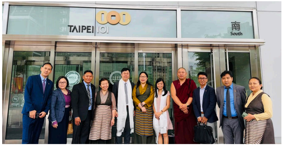
ཐའེ་ཐུན་གྱི་སྐབས་ ༡༦ པའི་སྲིད་འཛིན་གསར་བ་སྐྱེ་ཞབས་ Lai Ching-te མཚོག་དང་། སྲིད་འཛིན་གཞོན་པ་ལུང་ Hsiao Bi-Khim མཚོག་ གཉིས་ལས་འཁུར་དམ་འབྲུལ་མཛད་སྒྲོར་བཀའ་སློབ་གཉིས་ཀྱི་སྐྱེ་ཚབ་མཉམ་ཞུགས་སྐབས་འབྲེལ་ཡོད་དཔོན་རིགས་མཛུགས་འཛུགས་སྐབས།

མིའི་སྐྱེ་ཚབ་ཀྱི་དོ་བའི་ཐོག་མཛད་སྒྲོར་ཆེད་ བཅར་གནང་ཡོད་པ་མ་ཟད། གཞན་ཡང་ ཐའེ་ཐུན་བོད་རིགས་ཚོགས་པའི་ཚོགས་ གཙུག་པོ་ལགས་བོད་མི་ཁག་གཅིག་ཀྱང་མཛད་ སྒྲོར་མཉམ་ཞུགས་གནང་ཡུག།