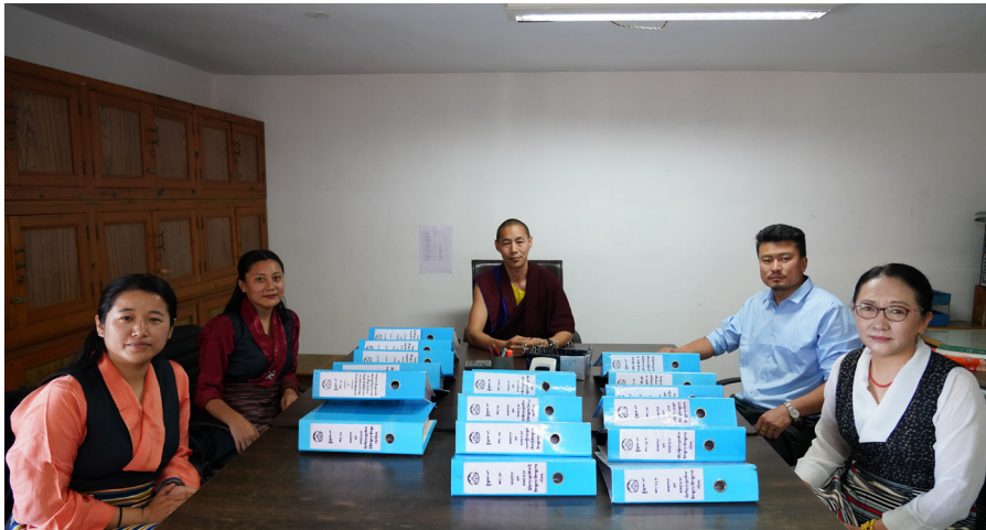
ཕྱི་ལོ་ ༢༠༡༩ ལྷ་ ༥ པའི་ཚེས་ ༡༩ ཉེན་མང་ཚོགས་ཅིས་ཁྲིམ་ཚོགས་ཚུང་སྐབས་ ༡༢ པའི་ལས་དོན་དངོས་སུ་དབུ་འཇུག་སྐབས་ལྟོ་བོ་

དེ་ནས་ཚོགས་ཚུང་གི་ཚོགས་མི་ རྣམས་ནས་སྲུང་སྲོལ་ལྷན་ དབུ་འཇུག་བོད་ མི་མང་སྤྱི་འཐུས་ཚོགས་གཙོ་མཚོག་གི་ བྱང་ནས་ལས་དོན་གནང་ཕྱོགས་ཀྱི་ལས་ སྟོན་ལྷན་ཚེས་དངོས་སུ་ལས་དོན་དབུ་ འཇུག་སྐབས་ལོ་དེ་པ་བཅས།