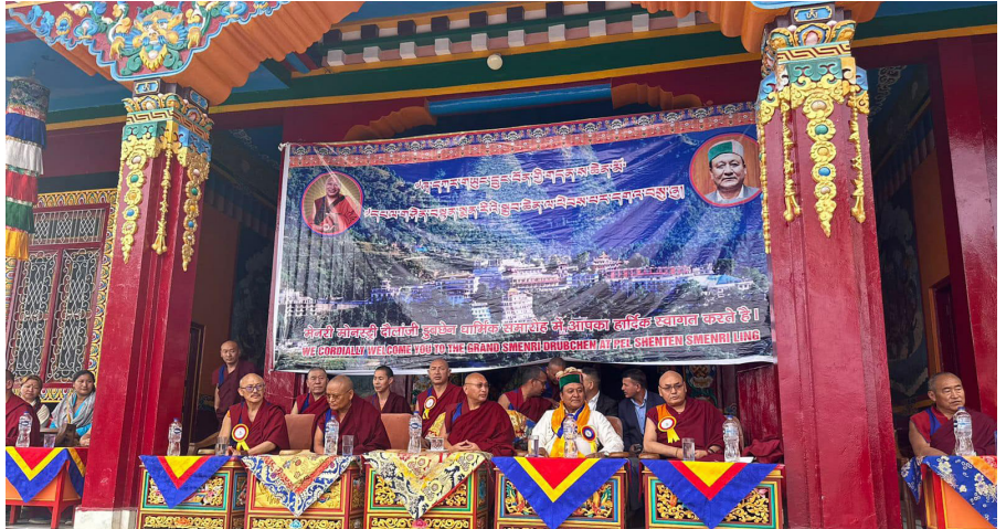
ཕྱི་ལོ་ ༢༠༡༩ ཟླ ༩ པའི་ཆེས་ ༡༡ ཉིན་པོན་གཞིས་པོ་ལན་རི་ལ་དཔལ་གཤེན་བསྐྱབ་སྐྱབ་རིམ་གྱི་འདུ་ཁང་ཆེས་ཆེན་འཕྲིལ་བ་སྐྱབ་ཀྱི་ རྒྱལ་ཚོན་དབུ་འཕྲེད་མཛད་སྐོར་སྐབས།

མགོན་གཙོ་བོ་རྣམས་ལ་དགོན་པའི་འདུ་ཁང་ དང་། བཤད་གྲུའི་འཆད་པ། དཔེ་མཛོད་ཁང་ བཅས་སུ་གཟིགས་སྐོར་གདན་འདྲེན་ཞུས་ ཟེས། ལ་སྐབས་ཇི་སྐབས་འདི་དཔོན་སློབ་རིན་ པོ་ཆེ་མཚོག་གིས་སྐྱབ་སྐྱབ་ཀྱི་བྱུང་རིམ་དང་ ཕན་ཡོན་སྐོར་གསུང་བཤད་གནང་བ་དང་། དེ་ནས་པོན་གཞིས་ནས་སྐོལ་རྒྱུན་གཤེན་ ཀྱི་གར་འཆམ་ཞིག་གཟིགས་འབྲུལ་གནང་ འདུག།