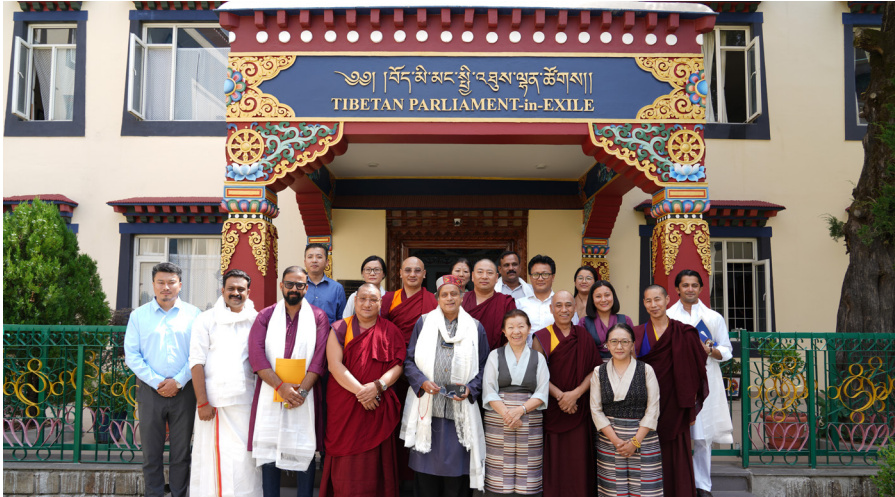
ཕྱི་ལོ་ ༢༠༢༤ ལྷ་ ༥ པའི་ཚེས་ ༣༠ ཉེན་ལྷན་ལྷན་ཁྲིམས་ཚོགས་ཡོག་མའི་འཇུག་མི་དང་། ལྷན་ཁྲིམས་གཞུང་གི་ཕྱི་སྲིད་ཚོན་ཆེན་ཟུར་པ་སྐུ་ཞབས་པོ་ལི་ཐ་རུར་ (Dr. Shashi Taroor) མཚོག་པོ་དང་མི་མང་སྤྱི་འཇུག་ལྷན་ཁང་དུ་ཕེབས་སྐབས་ལ།

ཕྱི་ཚུལ་པས་སྐྱོ་ལེན་དང་། དེ་རྗེས་སྐུ་ཞབས་པོ་ལི་ཐ་རུར་གྱི་ཚོགས་ཁང་ནང་གཟིགས་སྐོར་སྤྲོ་བྱིད་དང་སྐྱབས་པ་དཔལ་ལྷན་ཚོགས་གཞོན་མཚོག་གིས་བཅན་སྲོལ་པོ་ལེ་མང་གཞོན་པོ་ལེ་ལེ་ལེ་སྐོར་དང་། པོ་ལེ་མང་སྤྱི་འཇུག་ལྷན་ཚོགས་ཀྱི་ལས་དོན་གཞན་སྐོར་དོ་སྲོད་སྤྱི་བཟུས་ལུས་རྗེས། སྤྱི་འཇུག་ལྷན་ལས་ཚོགས་ཁང་ནང་དཔལ་ལྷན་ཚོགས་གཞོན་མཚོག་གིས་གཙོ་སྤྱི་འཇུག་ལྷན་པ་དང་། སྐུ་ཞབས་པོ་ལི་ཐ་རུར་ལེ་དབང་མཇུག་པོ་གཞན་པོ་སོང་།