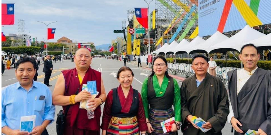
ཟ࿳་ལོ་ ༢༠༡༩ ཟ࿳་ ༥ ཚེས་ ༢༠ ཉེན་སྲོད་ཐའེ་ཐུན་གྱི་སྐབས་ ༡༦ པའི་སྲིད་འཛིན་གསར་བ་སྐྱེ་ཞབས་ Lai Ching-te མཚོག་དང་། སྲིད་འཛིན་ གཞོན་པ་ལུང་ Hsiao Bi-Khim མཚོག་གཉིས་ལས་འཁུར་དམ་འབྲུལ་མཛད་སྒྲོར་བཀའ་སློབ་གཉིས་ཀྱི་སྐྱེ་ཚབ་མཉམ་ཞུགས་གནང་སྐབས།