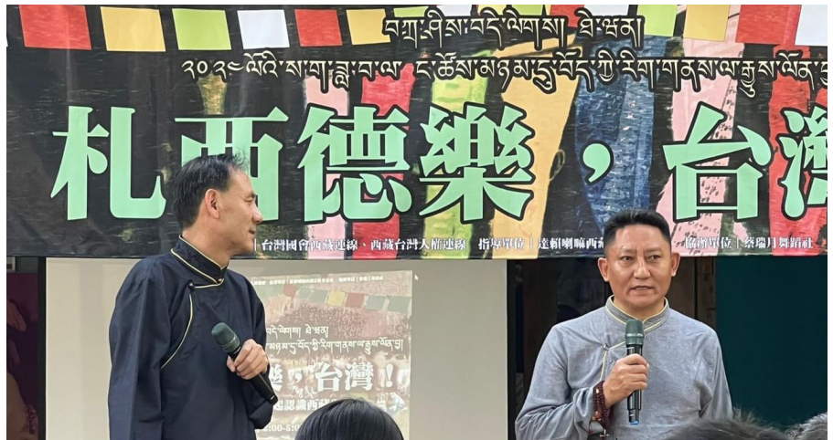
ཕྱི་ལོ་ ༢༠༢༠ ལོའི་ ༥ ཚེས་ ༡༤ ཉེན་ཕྱི་ཕྱིར་ "བཏུ་ཤིས་བདེ་ལེགས། ཐའེ་ཐོག་།" ཞེས་ཐའེ་ཐོག་གྲོས་ཚོགས་འཐུས་མི་དང་མང་ཚོགས་མཉམ་ དུ་བོད་དོན་གྲོང་སྟེགས་ཐོག་བཀའ་སྤྱིའི་སྤྱི་ཚབ་ཚོགས་ཀྱི་སྤྱི་ཚབ་ཚོགས་མཉམ་ཞུགས་ཀྱི་སྤྱི་ཚབ་ཚོགས་མཉམ་ཞུགས་