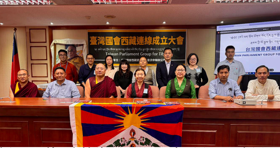
ཕྱི་ལོ་ ༢༠༢༤ ལྷོ་ ༥ པའི་ཚེས་ ༢༠ ཉིན་ཕྱི་ཕྱི་རོ་ཐལ་ཕན་གྲོས་ཚོགས་ཚོགས་ཁང་བྱང་ཐལ་ཕན་གྲོས་ཚོགས་སྐབས་ ༡༡ པའི་གྲོས་ཚོགས་ཐོག་དོན་རྒྱུ་བསྐྱོར་ཚོགས་པ་དངོས་སུ་དབུ་འཇགས་ཀྱི་མཛད་སྟོ་འཛིན་སྐབས།