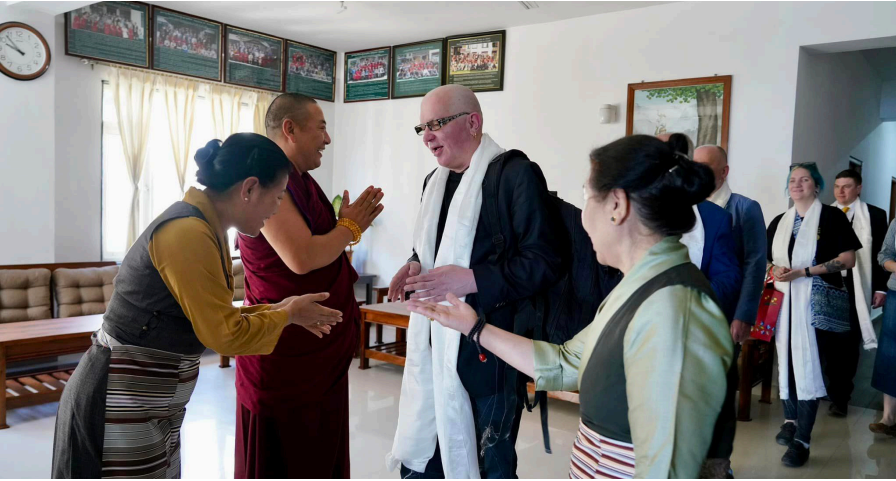
ཕྱི་ལོ་ ༢༠༡༩ ལྷ་ ལ ཚེས་ ༢༩ ཉིན་ཨི་སི་ཏོ་ནི་ཡའི་ཤྲོ་མ་ཚོགས་པོད་དོན་རྒྱུ་སྤོང་ཚོགས་པའི་ཚོགས་གཙོ་སྐུ་ཞབས་ཏུ་ཀུ་ལེ་ དེ་ཤི་ (Juku-Kalle Raid) མཚོག་གིས་དབུ་སྤེད་པའི་ཤྲོ་མ་ཚོགས་པའི་ཚོགས་པའི་ཚོགས་གཙོ་སྐུ་ཞབས་ཏུ་ཀུ་ལེ་ དེ་ཤི་ སྐུ་ཞབས་སྐབས་།

དེ་བཞིན་སྤྱི་འཇུག་ལས་ཀྱི་ པ་དང་། ཨི་སི་ཏོ་ནི་ཡའི་སྐུ་ཚབ་ཚོགས་ ཚུང་བར་བཀའ་བསྟུན་སྐྱུ་ག་པོ་གཞན་རྗེས་ སྐུ་ཚབ་ཀྱིས་པས་བོད་ཀྱི་ཅ་དོན་ཐོག་རྒྱུ་ སྤོང་སྤུ་མ་མུད་གནང་རྒྱུ་ལས་ལེན་གནང་ ཡོད་པ་རེད།