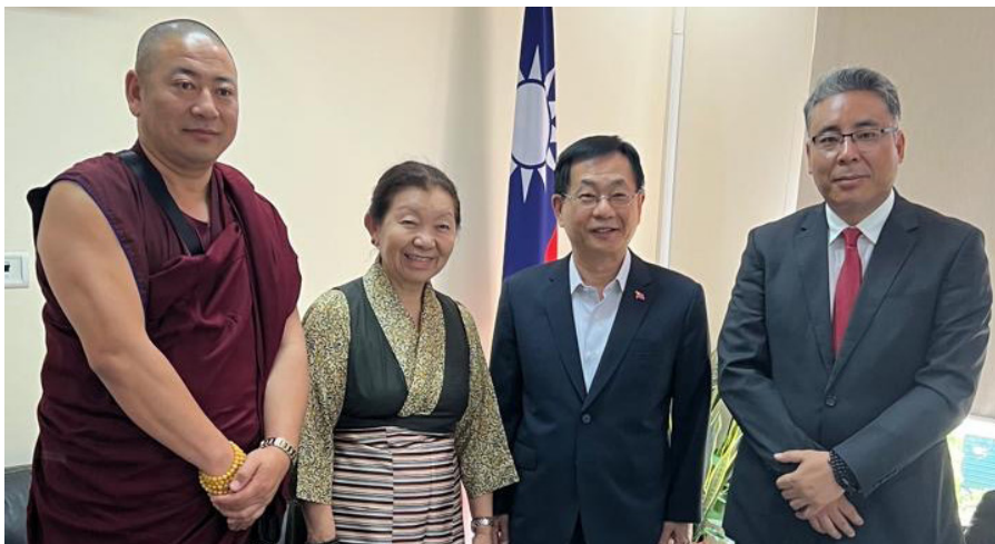
ཕྱི་ལོ་ ༢༠༡༩ ལྷ་ ༥ པའི་ཚེས་ ༡༩ ཉེན་དབུ་འཇུག་ཚོགས་གཙོན་མཚོག་དང་། སྤྱི་འཐུས་བཟུན་པ་ཡར་འཕེལ་མཚོག་རྣམས་ཀྱིས་རྒྱལ་ ས་ལྷོ་ལིར་བཅའ་སྲོད་ཐའེ་ཕན་གཞུང་ཚབ་སྤྱི་ཚོགས་ཀྱི་ལྷོ་ལིར་ (Baushuan Ger) མཚོག་དང་མཇུག་འཕྲད་གནང་སྐབས་།

སྐབས་དེར་ཐའེ་ཕན་དང་བོད་མིའི་སྤྱི་ག་ འཇུག་གི་མང་གཙོའི་འཕེལ་རིམ། དེ་ བཞིན་ཐའེ་ཕན་དང་བོད་མིའི་དབར་འབྲེལ་ བ་དམ་ཟབ་གནང་ཕྱོགས་ཐད་བཀའ་མོལ་ ལྷུག་པོ་གནང་འདུག།