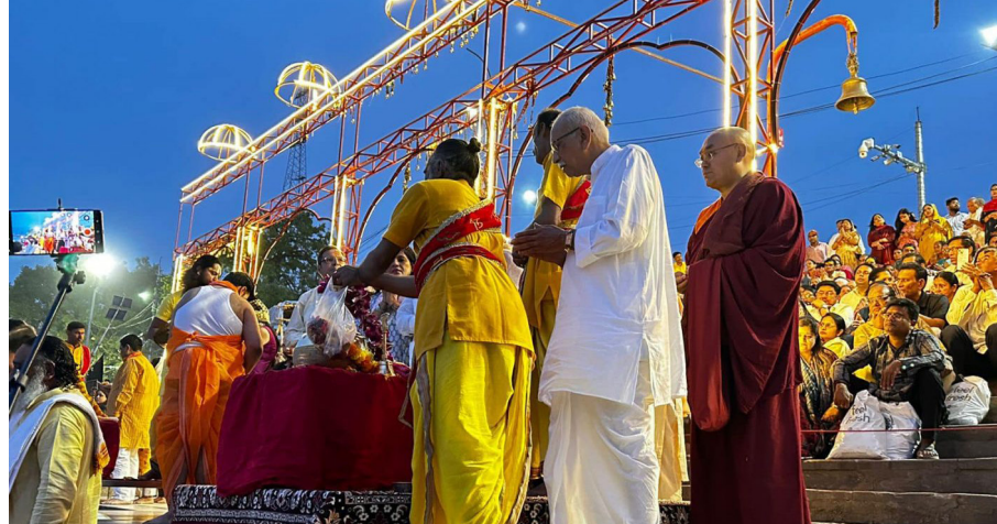
ཕྱི་ལོ་ ༢༠༡༩ ཟླ ༩ པའི་ཆེས་ ༢༡ ཉིན་དཔལ་ལྷན་ཚོགས་གཙོ་མཚོག་ཨ་ཡོ་རྫོ་ (Ayodhya) རྒྱ་གདན་ཞུས་ལྟར་རྒྱ་གར་སྐུ་ལྷུང་ལྷ་ཁང་ ཉི་ (Saryu Ghat 'Arti') མཚོན་འབྲུལ་གྱི་མཛད་སྐོར་མཉམ་ཞུགས་ཞུས་པའི་སྐབས་ལ།

༢༡ ཕྱི་ལོ་ ༢༠༡༩ ཟླ ༩ ཆེས་ ༢༡ ཉིན་དཔལ་ལྷན་ཐོད་མི་མང་སྤྱི་འཐུས་ ཚོགས་གཙོ་མཁན་པོ་བསོད་ནམས་བསྐྱབ་ འཕེལ་མཚོག་ཨ་ཡོ་རྫོ་ (Ayodhya) རྒྱ་ འབྲུང་ཇི་སྐོར་དགོང་མོར་རྒྱ་གར་གྱི་རིག་ གཞུང་དང་ཆེས་ལུགས་ལ་གྲུས་བཀུར་ མཚོན་ཕྱིར་སྐུ་ལྷུང་ལྷ་ཁང་ཉི་ (Saryu Ghat 'Arti') མཚོན་འབྲུལ་གྱི་མཛད་སྐོར་ མགོན་འབོད་གནང་དོན་བཞེན་མཉམ་