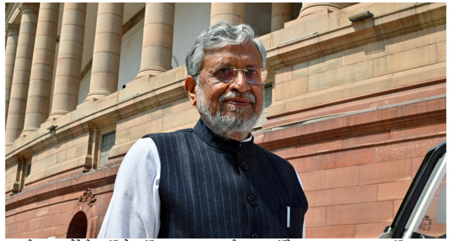
རྒྱ་གར་རྩི་ཉར་མངའ་སྡེའི་སྤྱི་ཁྱབ་སློབ་ཚན་གཞོན་པ་རྒྱུ་པ་སྐྱེ་ཚབ་སྤྱི་འཐུས་སུ་ལོལ་ ཀུ་མར་ མོ་རྩི་ (Shri Sushil Kumar Modi) མཚོགས།

པའི་ཡིད་སློབ་འདི་གནས་ཚུལ་གོ་བར་ཉ་ཅང་ གིས་སློབ་མཚན་པོ་བྱུང་། དམ་པ་ཚེ་འདས་ ཁོང་གི་བོད་དོན་ཐོག་རྒྱལ་སྤྱི་ལྷན་ཚོགས་ཚེ་ གནང་མཁན་ཞིག་དང་བོད་པའི་སྤྱོད་པ་ལོ་ ལག་པོ་ཞིག་ཀྱང་ཡིན་པས། ད་ཆ་ཁོང་སྐྱེ་ ཚེའི་འཕེན་པ་རྩོགས་པ་འདི་བོད་དང་བོད་མི་ ཚོར་གྱིང་གུན་ཚེན་པོ་ཞིག་ཡིན།