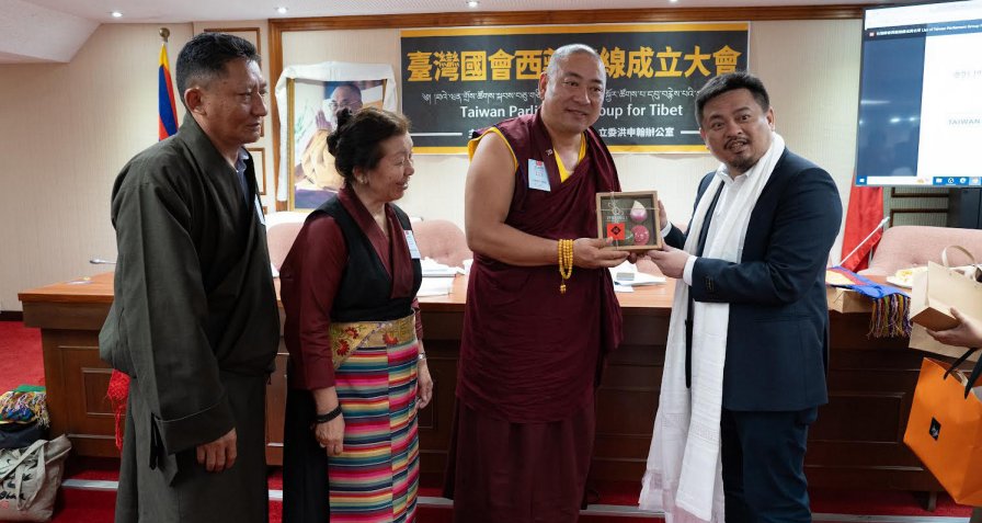
ཕྱི་ལོ་ ༢༠༢༤ ལྷོ་ ༥ པའི་ཚེས་ ༢༠ ཉིན་ཕྱི་ཕྱི་རོ་ཐལ་ཕན་གྲོས་ཚོགས་ཚོགས་ཁང་བྱང་ཐལ་ཕན་གྲོས་ཚོགས་སྐབས་ ༡༡ པའི་གྲོས་ཚོགས་ཐོག་དོན་རྒྱུ་བསྐྱོར་ཚོགས་པ་དངོས་སུ་དབུ་འཇགས་ཀྱི་མཛད་སྟོ་འཛིན་སྐབས།