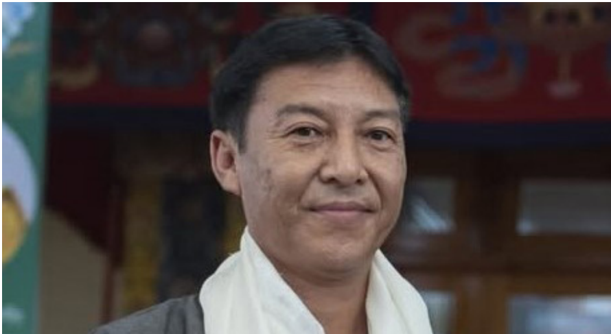
བོད་མི་མང་སྤྱི་འཐུས་ལྷན་ཚོགས་ཤོས་ཚོགས་ཚོགས་དུས་དགུ་པའི་ཐོག་སྤྱི་ཁྱབ་ཅིས་ཞིབ་ལས་ཁང་གི་བྱང་ཆེ་བཟ་འིས་སྟོབས་རྒྱལ་ལགས་སྤྱི་ཁྱབ་ཅིས་ཞིབ་ལས་ཁང་གི་ཅིས་ཞིབ་སྤྱི་ཁྱབ་པར་བདམས་ཐོན་བྱུང་བ།