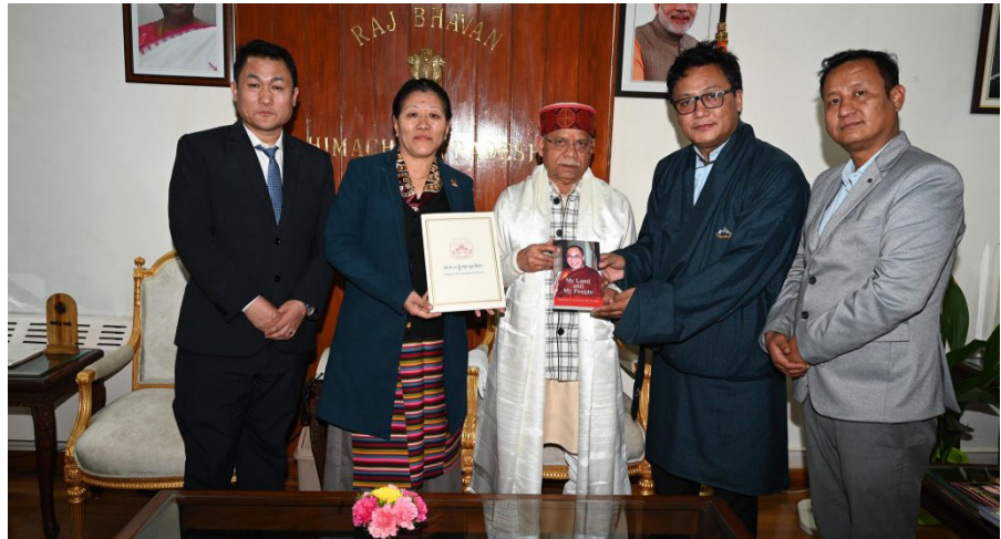
ཕྱི་ལོ་ ༢༠༡༥ ལྷ་ ༩ ཚེས་ ༩ ཉིན་སྤྱི་འཇུག་ཚན་ཚང་དོན་འགྲུབ་བཀའ་ཁྲིམས་མཚོག་དང་སྤྱི་འཇུག་ཆེ་ཤིང་དབྱངས་ཅན་མཚོག་ཆུ་གཉིས་ཆུ་ ཉི་ལྷ་ཅལ་མངའ་སྡེའི་གཞུང་གི་སྤྱི་དྲུང་ལོ་བ་ སར་ཉེབ་ འུག་ལ་ (Governor Shiv Pratap Shukla) མཚོག་དང་ལྷན་མངལ་འབྲང་གནང་ སྐབས།

ཕྱི་ལོའི་ཚུ་ཚོད་ ༩།༥༠ ཉེང་ མངའ་སྡེ་ཁལ་བསྐྱེད་སྐོན་ཆེན་སྐུ་ཞབས་རྒྱ་ ཟུག་ སི་རྒྱ་ བེ་རྩི་ (Revenue Minister Shri Jagat Singh Negi) མཚོག་དང་ མངལ་འབྲང་བྱས་ཏེ། སྤྱི་འཇུག་ཆུ་གཉིས་ ཀྱིས་རྒྱ་གར་གཞུང་གིས་གཏན་འབེབས་ གནང་བའི་བཅོམ་བྱོལ་བོད་མིར་མཐུན་ རོགས་སྐོར་སྡོད་ཁྱེད་ཕྱོགས་ཀྱི་སྤྱི་བྱས་ཕྱི་