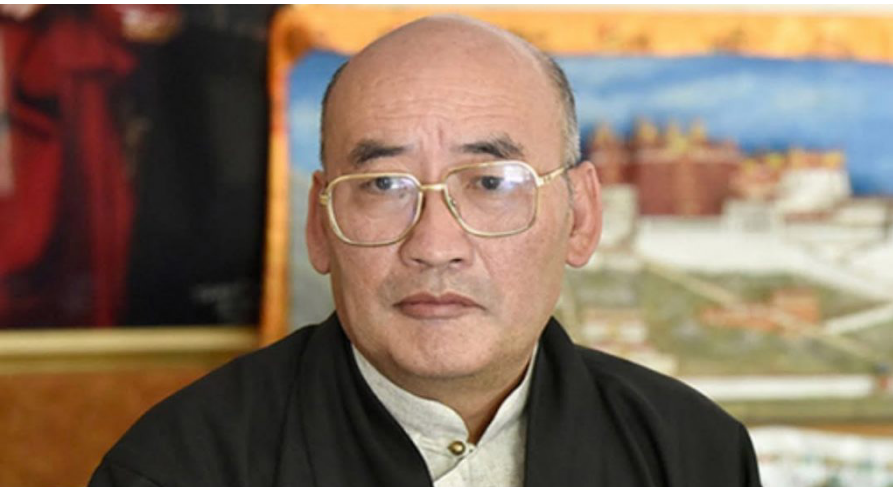
པོད་མི་མང་སྤྱི་འཐུས་ལྷན་ཚོགས་ཀྱི་མཉམ་ཚོགས་ཚོགས་པུས་དགུ་པའི་ཐོག་བཀའ་བླུང་འཕགས་པ་ཆེ་རིང་མཚོག་ཆེས་མཐོའི་ཁྲིམས་ཞིབ་ཁང་གི་ཁྲིམས་ཞིབ་པ་གཞན་ལ་བདམས་ཐོན་བྱུང་བ།

གིས་སྤྱི་འཐུས་ལྷན་པུན་གྱི་དམངས་ཆེས་མཐོག་དང་། སྤྱི་འཐུས་དབུ་དཀར་ཚང་གཡུ་སློན་མཚོག་ ཕུར་ཕུ་རྩོ་རྩེ་ལགས་བཅས་གསུམ་འཆར་ འབྲུལ་བྱུང་བར། རོ་ཡོད་སྤྱི་འཐུས་རྣམས་ ནས་གསང་བའི་འོས་ཤོག་འཕངས་ཏེ་སྤྱི་ འཐུས་ལྷན་པུན་གྱི་དམངས་ཆེས་མཐོག་ལ་འོས་ གངས་ ༡༥ དང་། སྤྱི་འཐུས་དབུ་དཀར་ ཚང་གཡུ་སློན་མཚོག་ལ་འོས་གངས་ ༧། ཕུར་ཕུ་རྩོ་རྩེ་ལགས་ལ་འོས་གངས་ ༤ ཐོབ་ བ་དང་། འོས་གངས་ ༧ ཅིས་མེད་བྱུང་བ་ བཅས་དབུ་ལྡན་ཚོགས་གཙོ་མཚོག་གིས་ སྤྱི་འཐུས་ལྷན་པུན་གྱི་དམངས་ཆེས་མཐོག་མང་མོས་ ཐོག་ཆེས་མཐོའི་ཁྲིམས་ཞིབ་ཁང་གི་ཁྲིམས་ ཞིབ་པ་གཞན་ལ་བདམས་ཐོན་བྱུང་བའི་ གསལ་བསྒྲགས།