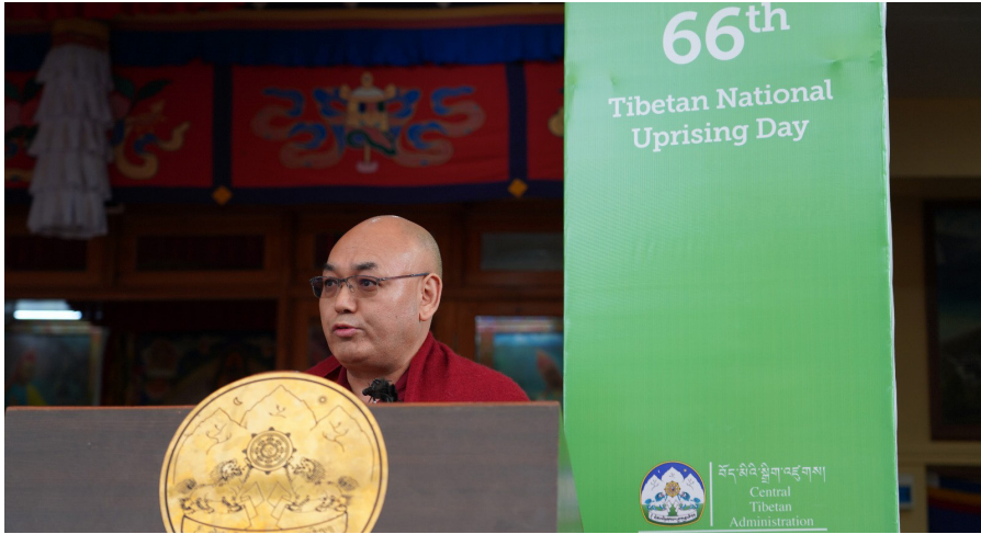
ཕྱི་ལོ་ ༢༠༢༡ ཟླ་ ༩ ཚེས་ ༡༠ ཉིན་བོད་མིའི་རང་དབང་སྐྱེད་ལངས་གསུམ་བཅུའི་དུས་དྲན་ཟེངས་ ༤༤ པའི་ཐོག་བོད་མི་མང་སྤྱི་འཐུས་ལྷན་ཚོགས་ཀྱི་ཚོགས་གཞོན་པ་ལོ་འཕྲོད་ལྷན་པ་ལྷན་འབེལ་མཚོགས་ཀྱི་བོད་མི་མང་སྤྱི་འཐུས་ལྷན་ཚོགས་ཀྱི་གསུང་བཤད་རྒྱུ་སྤྲེལ་གནང་སྐབས།

༡༣༧། དེ་རིང་གི་ཉིན་མོ་ནི་ཕྱི་ལོ་ ༡༩༥༤ ཟླ་ ༩ ཚེས་ ༡༠ ཉིན་བོད་ཀྱི་རྒྱལ་ས་ལྷ་སར་ཚོལ་གསུམ་བོད་མི་རྣམས་ཀྱིས་མ་གྲོས་བསམ་པ་གཅིག་མཐུན་ཐོག་རྒྱ་ནག་གཞུང་གིས་བསམ་སྟོན་དབུ་པོར་ཞི་བའི་སྐྱེད་ལངས་བྱས་ཏེ་མི་ལོ་ཉིལ་པོ་ ༤༤ འཁོར་བའི་ཤིན་ཏུ་བརྗེད་པར་དཀའ་བའི་དུས་ཚོགས་གཅིག་དང་། བོད་བརྟན་སྲིད་མི་རིགས་ཀྱི་དོན་དུ་ལུས་སྲོག་ལོངས་སྟོན་དང་བཅས་པ་སྒྲོམ་གཏོང་གནང་མཁན་རྒྱལ་གཅེས་དབང་པོ་དབང་མོའི་རྗེས་དྲན་གྱི་ཉིན་མོ་ཞིག་གྲང་ཆགས་ཡོད། དེ་ཡང་ཕྱི་ལོ་ ༡༩༤༩ ལོར་རྒྱ་ནག་མི་དམངས་སྤྱི་