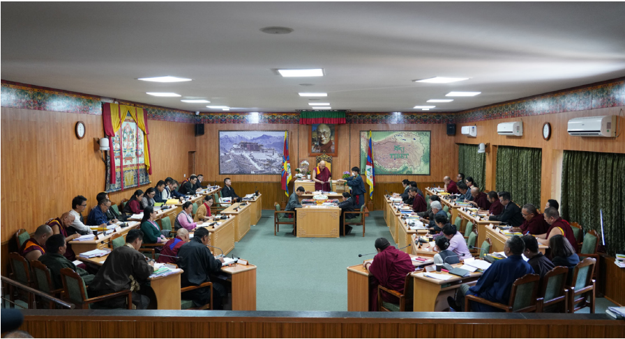
སྐབས་བཅུ་བདུན་པའི་བོད་མི་མང་སྤྱི་འཐུས་ལྷན་ཚོགས་ཀྱི་ཕྱོས་ཚོགས་ཚོགས་དུས་དགུ་པའི་ལས་ཉིན་བརྒྱ་གཉིས་པའི་ཐོག་ཆེས་མཐོའི་ཁྲིམས་ཞིབ་ཁང་གི་ཁྲིམས་ཞིབ་པ་ཆེ་བ་དང་། ཁྲིམས་ཞིབ་པ་གཞན་གཉིས། དེ་བཞིན་སྤྱི་ཁྱབ་ཅིས་ཞིབ་པ་བཅས་ལ་ངོ་ཡོད་སྤྱི་འཐུས་རྣམས་ནས་གསང་བའི་ངོས་ཤོག་འཕེན་སྐབས།