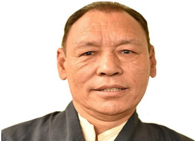
པོད་མི་མང་སྤྱི་འཐུས་ལྷན་ཚོགས་ཀྱི་མཉམ་ཚོགས་ཚོགས་པུས་དགུ་པའི་ཐོག་སྤྱི་འཐུས་ལྷན་པུན་གྱི་དམངས་ཆེས་མཐོའི་ཁྲིམས་ཞིབ་ཁང་གི་ཁྲིམས་ཞིབ་པ་གཞན་ལ་བདམས་ཐོན་བྱུང་བ།