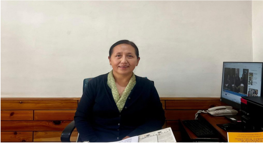
པོད་མི་མང་སྤྱི་འཐུས་ལྷན་ཚོགས་ཀྱི་མཉམ་ཚོགས་ཚོགས་པུས་དགུ་པའི་ཐོག་གི་ཁྲིམས་ཞིབ་ལེ་ཤེས་དབང་མོ་ལགས་ཆེས་མཐོའི་ཁྲིམས་ཞིབ་ཁང་གི་ཁྲིམས་ཞིབ་ཆེ་བར་བདམས་ཐོན་བྱུང་བ།