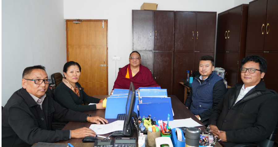
ལྷོ་ལོ་ ༢༠༢༥ ཟླ་ ༣ ཚེས་ ༡༢ ཉིན་ཅིས་ལོ་ ༢༠༢༥...༢༠ ལོའི་བོད་མིའི་སྤྲིག་འཇུག་གི་ཕྱོད་ཅིས་ཚོད་དཔག་འཆར་ཅིས་ཚོགས་ཚུང་གི་ལས་དོན་དབུ་འཇུག་ས་གནས་བཞུགས་པ།

༢༡། བོད་མིའི་སྤྲིག་འཇུག་གི་ལས་ཁུངས་མ་ལག་ཁྲུབ་ཁོངས་དང་བཅས་པའི་ལོ་འཁོར་ཕྱོད་ཅིས་འཆར་གཞིར་བོད་མི་མང་སྤྱི་འཐུས་ལྷན་ཚོགས་ཀྱི་ཚོད་དཔག་འཆར་ཅིས་ཚོགས་ཚུང་ཆེད་འཇུག་ས་གནས་ཞིབ་འཇུག་ནན་ཏན་གྱིས་ཕྱོས་ཚོགས་སུ་གྲུབ་དོན་སྣེ་མོ་འབྲུལ་ལམ་ལུ་སློབ་ཡོད་པ་ལྟར། བོད་མི་མང་སྤྱི་འཐུས་ལྷན་ཚོགས་ཀྱི་ཚོགས་འདུའི་འགོ་ཁྲིམས་དང་། ལས་དོན་གྱི་འཇུག་ས་ཀྱི་སྤྲིག་གཞི། དོན་ཚན་རེ་རྒྱལ་པ། ལོ་འཁོར་ཕྱོད་ཅིས་འཆར་འབྲུལ་དང་། ཕྱོད་ཅིས་ཚོད་དཔག་འཆར་ཅིས་ཚོགས་ཚུང་ཞེས་པའི་ནང་གསེས་ ༡ “བོད་མིའི་སྤྲིག་འཇུག་གི་ལས་ཁུངས་མ་ལག་ཡོད་པ་རྗེས་ཀྱི་ཕྱོད་ཅིས་འཆར་ལོའི་ཡོང་འབབ་དང་། འགོ་སོང་གི་ཡོད་ལུང་འཛོག་བཅས་འཆེམས་སུ་མེད་པའི་ལོ་འཁོར་ཕྱོད་ཅིས་འཛོད་འབྲུལ་བྱུང་བ་ཕྱོས་ཚོགས་སུ་བཀའ་འཁོབ་ལོ་བསྐྱར་ཆེད་ཕྱོད་ཅིས་ཚོད་དཔག་འཆར་ཅིས་ཚོགས་ཚུང་ཞིག་ཚོགས་གཙོ་སྐུལ་ལོ་འཁོར་ལོ་འཁོར་ལོ་འཁོར་དགོས་དམིགས་འཇུག་གིས་བསྐྱོ་གཞིག་གྲུ་དགོས། དེའི་དུས་ལྡན་ཚོགས་གཙོ་སྐུལ་ལོ་འཁོར་གཏན་འཁེབས་ཀྱི་བྱས་ལྟར་ཡིན།” ཞེས་པའི་དགོངས་དོན་གཞིར་བཟུང་།